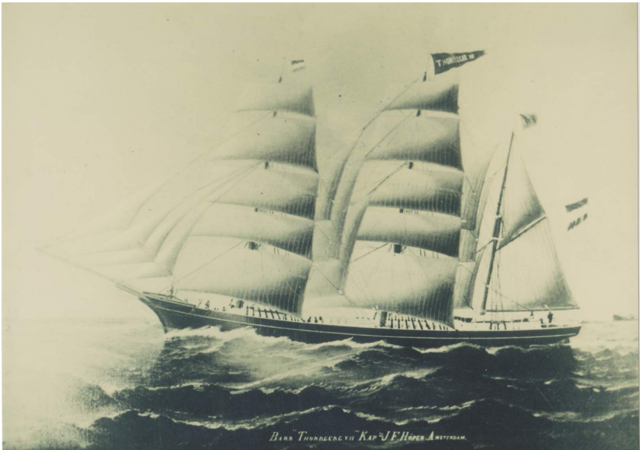
BARK "THORBECKE VII" KAP J.F. HÖPER AMSTERDAM.