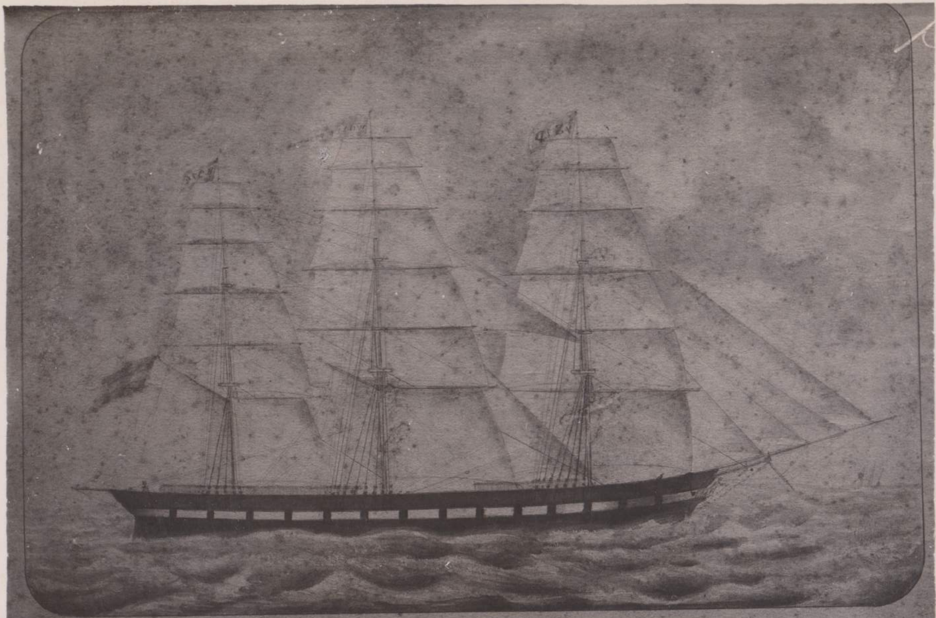
Copy of a drawing of the three-masted sailing ship "Willow" from the collection of the U.S. Navy.