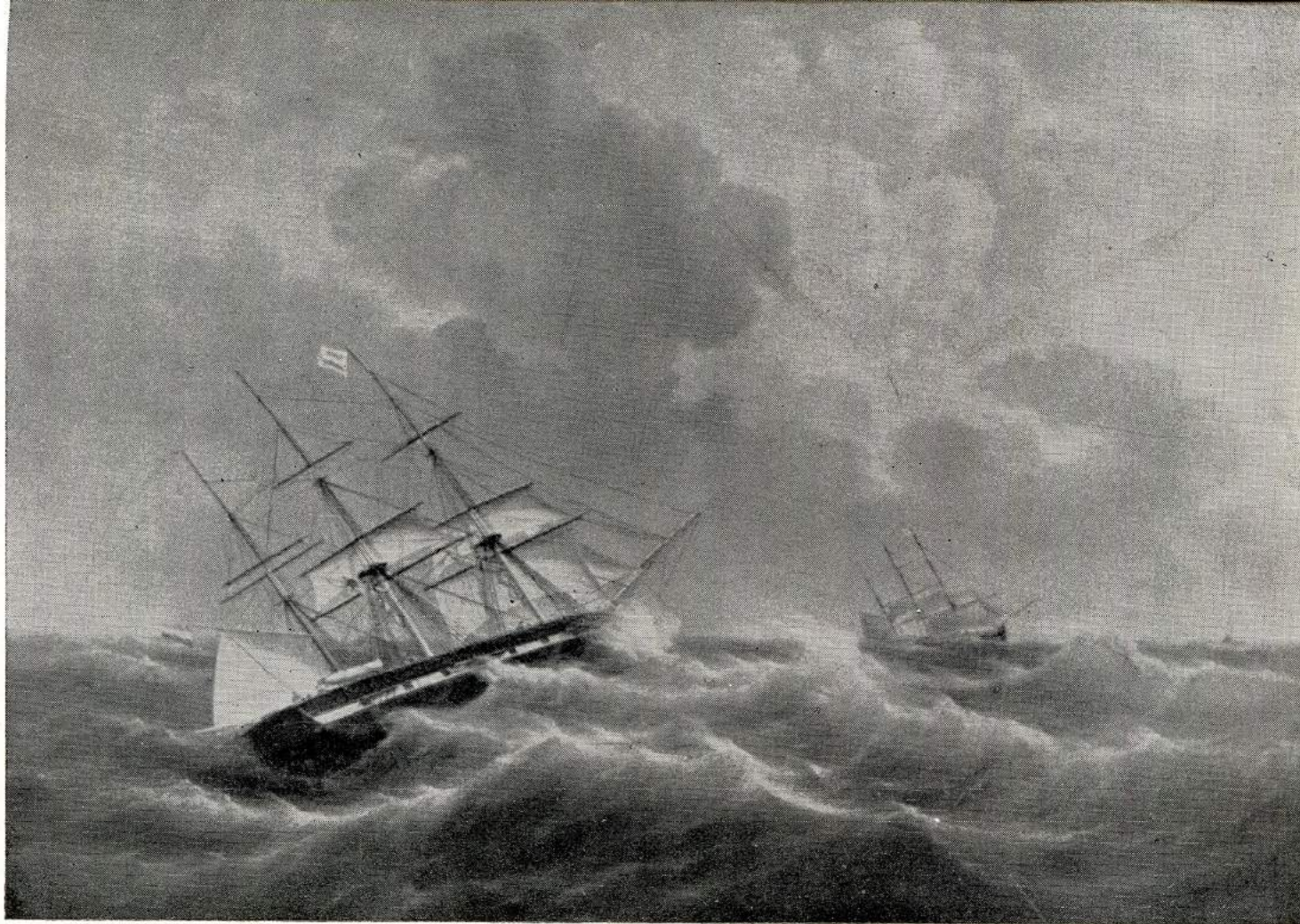
Fregat „JAN VAN HOORN” bijliggend onder klein zeil