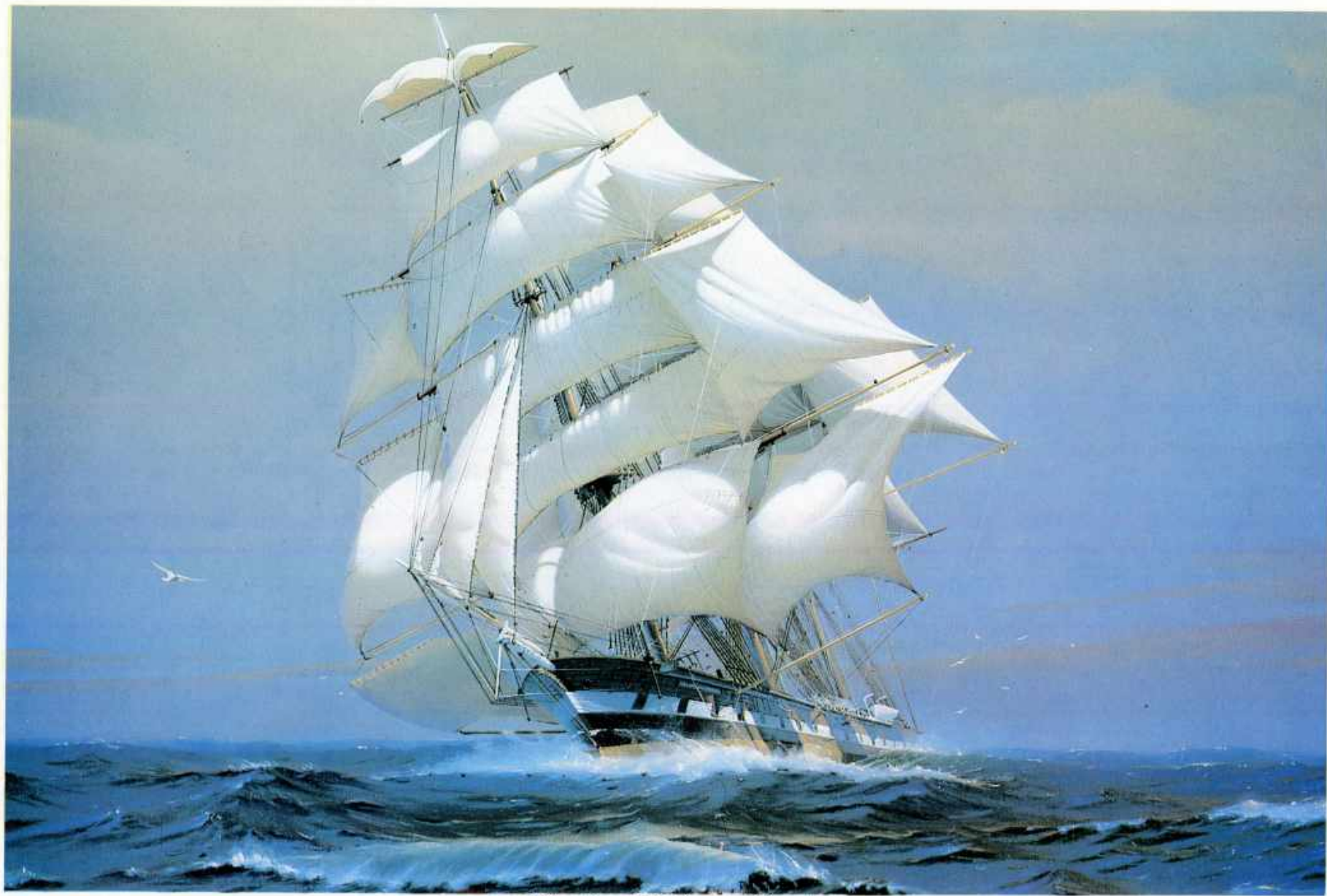
Clippersfregat "Philips van Marnix"