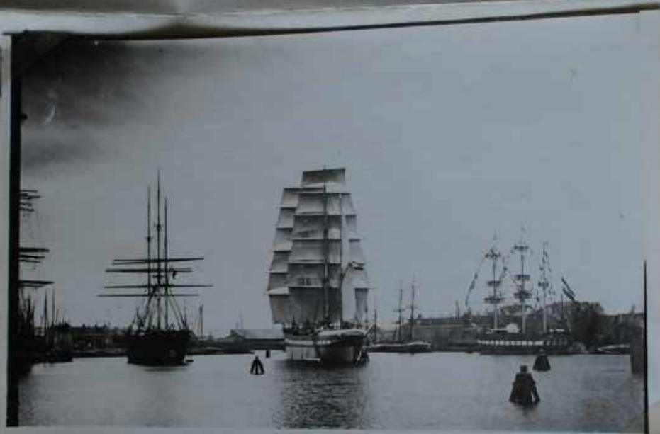
Oosterdek te Amsterdam bark "Columbus in het midden.