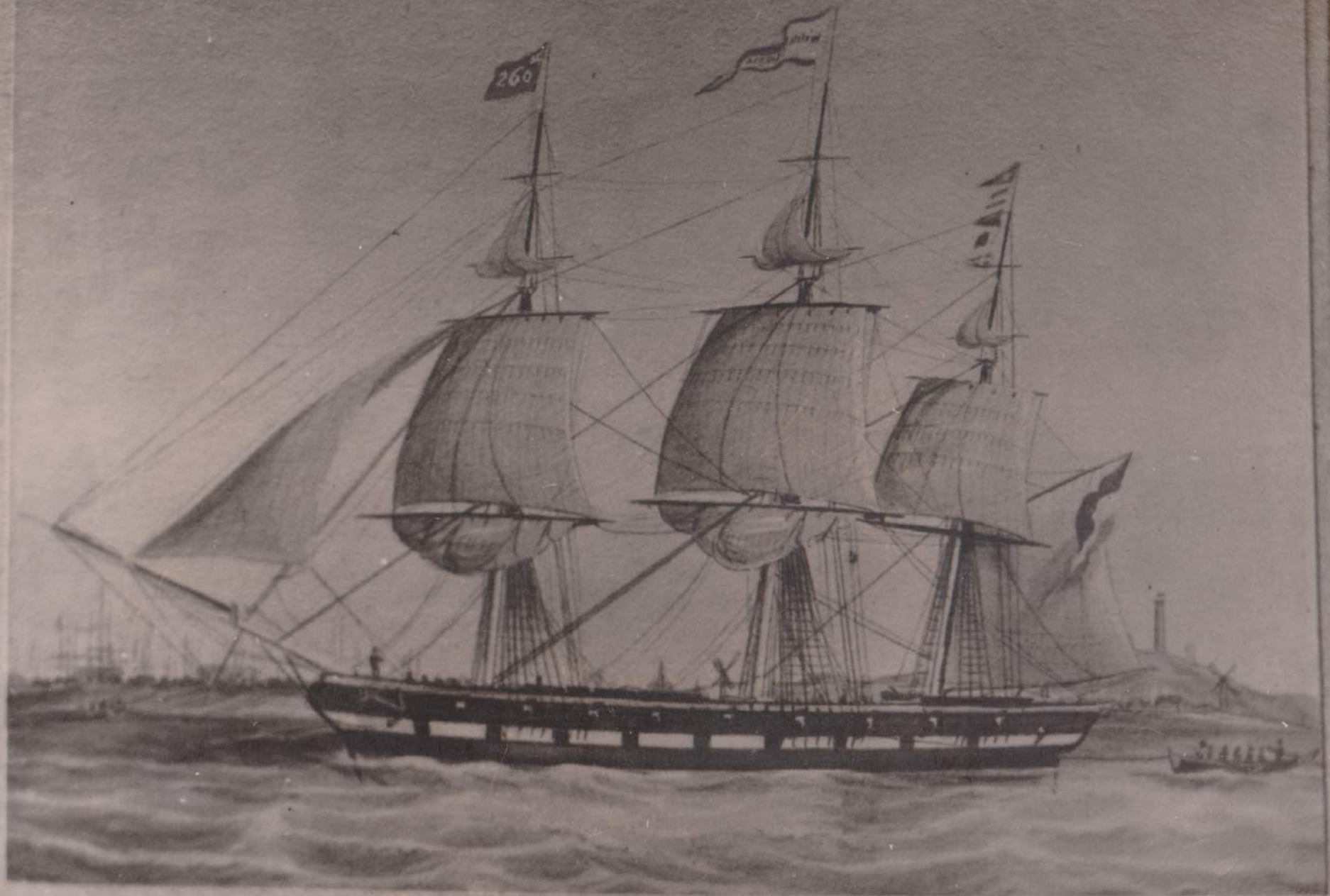
ШОУНЕРЪ ИМЕНИ А. БУСОВА. КАПТ. J. P. CARST. 1846