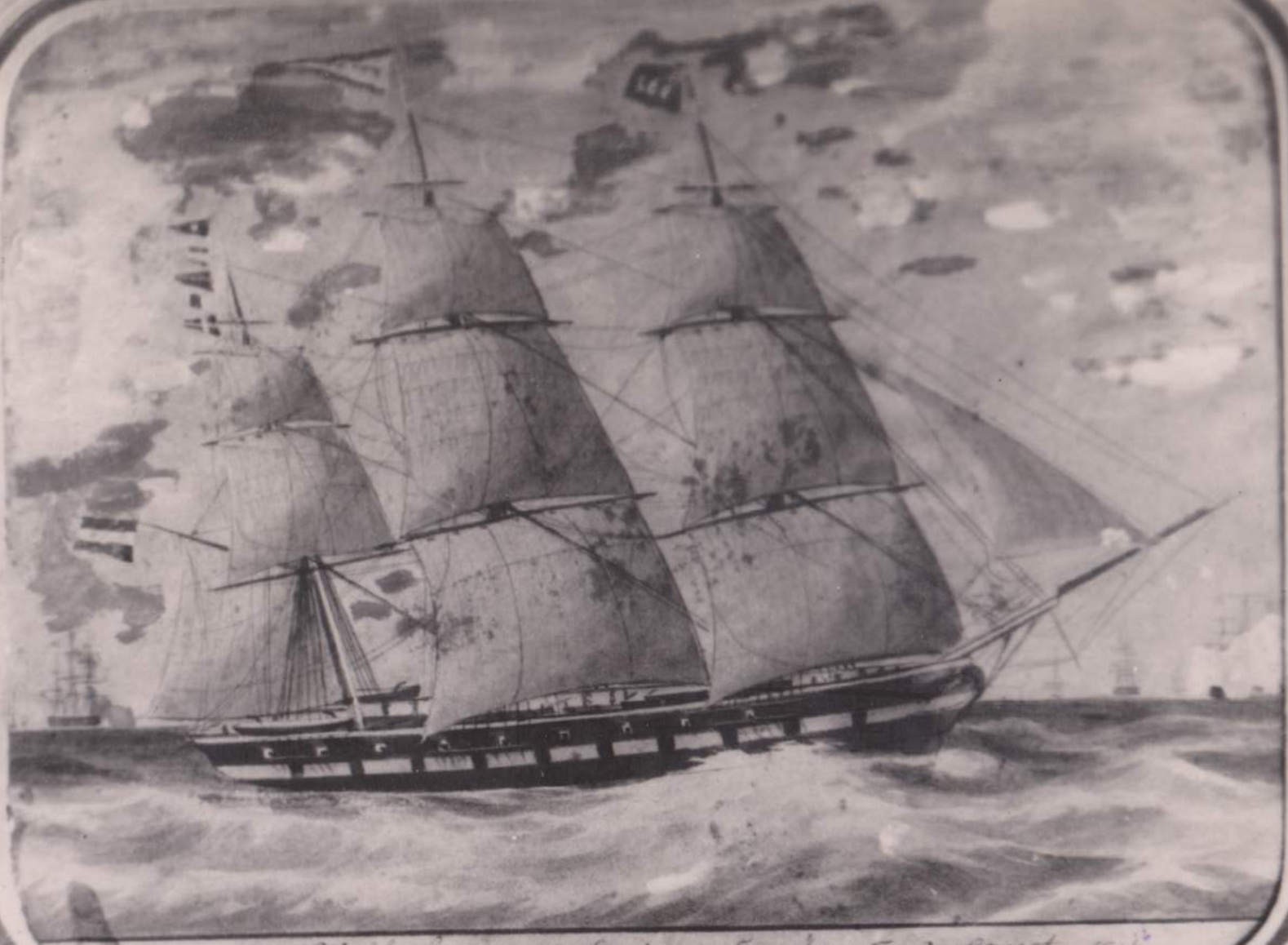
Wilhelmener Lucia, Kapitän F. P. Carst 1841