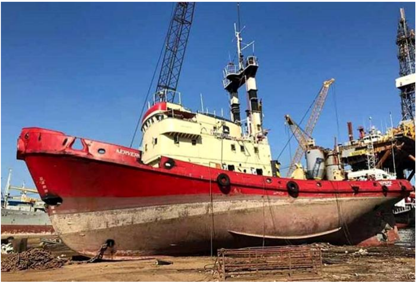
KERVEROS op de sloop, foto Captain Selim

ZHEN HUA 13, IMO 8008761, 17-11-1983 opgeleverd door ASTANO - Astilleros y Talleres del Noroeste S.A., El Ferrol, Spanje ((260) als MARINE RENAISSANCE aan Oswego Erie Corp., Liberia (Marine Transport Lines Inc., New York). Tanker. 41.833 BRT, 81.279 DWT. 1989 verkocht aan K/S Dido-Noorwegen, (Borgestad-Reim Shipping AS, Porsgrunn) herdoopt DIDO. 1993 verkocht aan Dimena Shipping Co. Ltd., Cyprus (Tsakos Shipping & Trading S.A.), herdoopt TAMYRA. 10-2005 verkocht aan Zhen Hua 13 Shipping (SVG) Co. Ltd., Shanghai, vlag: St. Vincent & the Grenadines, in beheer bij Shanghai Zhenhua Shipping Co. Ltd., Shanghai en ZPMC - Shanghai Zhenhua Port Machinery Co. Ltd., Shanghai, herdoopt ZHEN HUA 13. 19-12-2005 aanvang verbouwing tot Bridge Crane and Heavy Equipment Carrier. 8-3-2006 in de vaart na verbouwing. 16-9-2018 als ZHEN 3 gearriveerd Gadani anchorage, 26-9-2018 op het strand gezet om gesloopt te worden. (Foto: T. v.d. Zee, 25-6-2008, ECT).