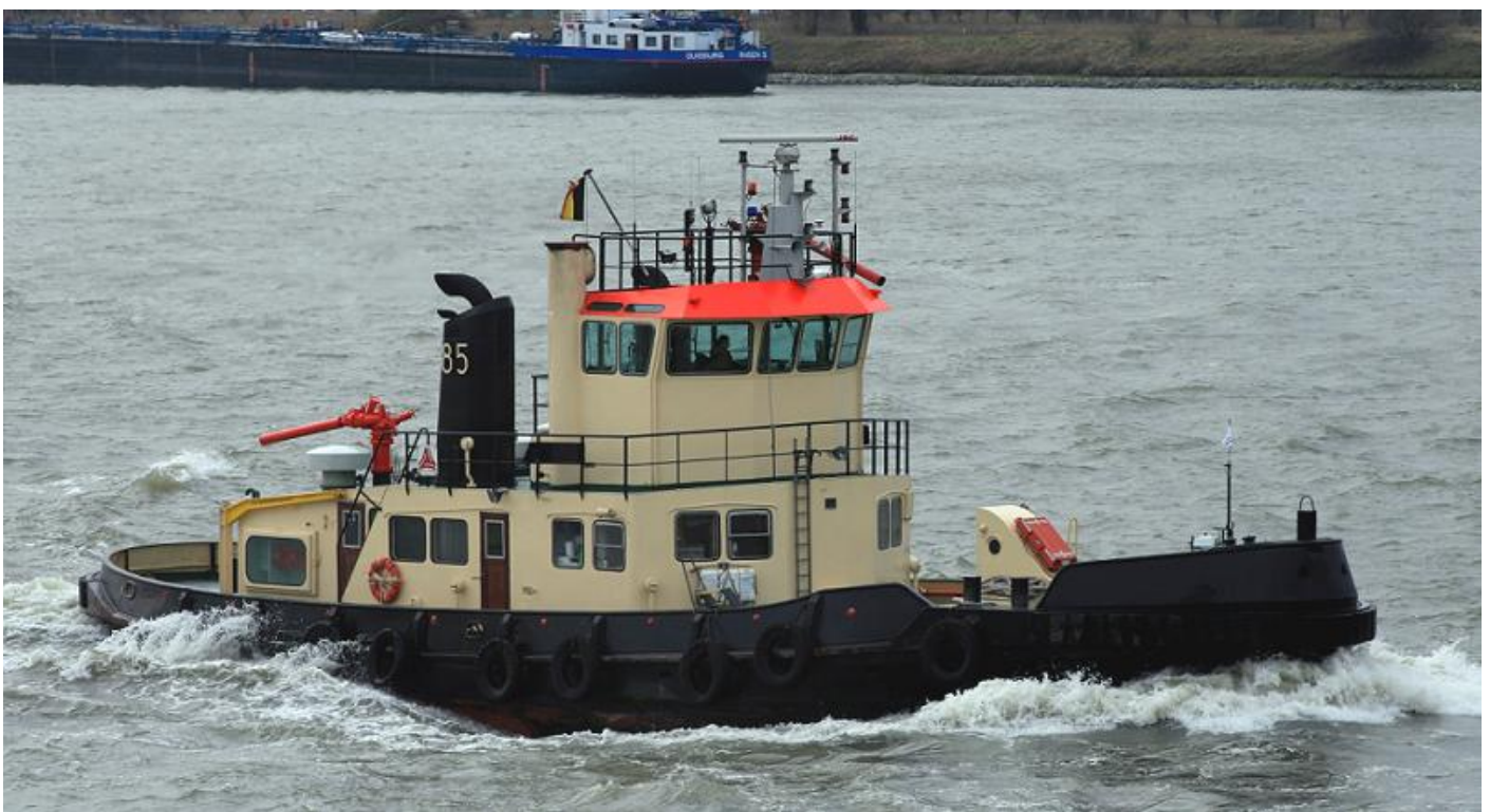
85 te Antwerpen, foto T. v.d. Zee, 1-4-2006

Medio september 2018 lagen er 4 oudere stadssleepboten van het Gemeentelijke Havenbedrijf Antwerpen te Gent om gesloopt te worden bij Van Heyghen Recycling N.V. (Galloo N.V.). Dat waren de 73, 74, 75 en 86. Ook gesloopt daar zijn de 84 en 85. (Foto 84, 74 en 73 te Antwerpen: T. v.d. Zee, 1-9-2012).