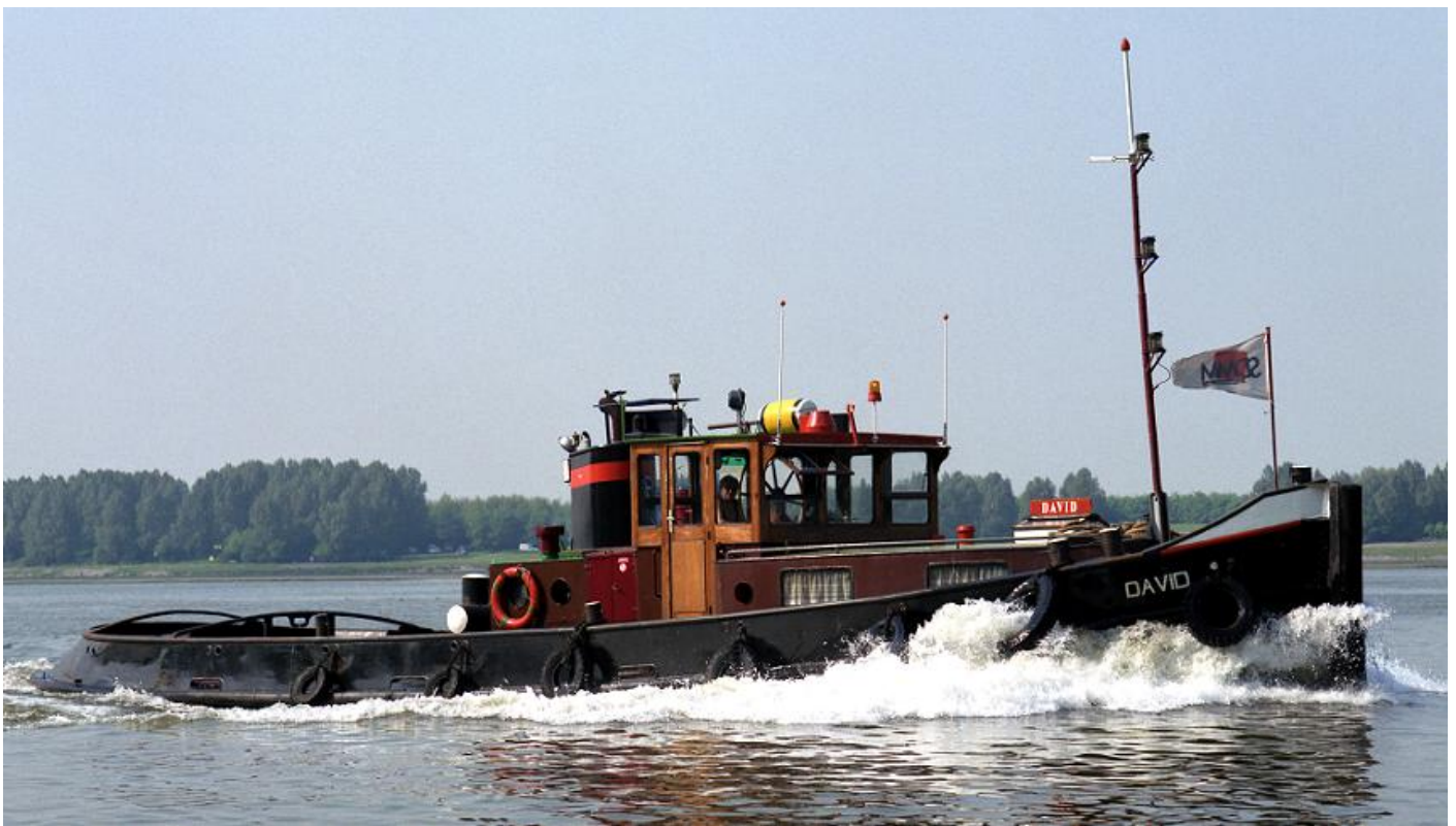
m.s. DAVID op de Nieuwe Waterweg, 4-5-1995

Maatschappij Drijvende Bokken V/H. Bonn & Mees B.V., Rotterdam.