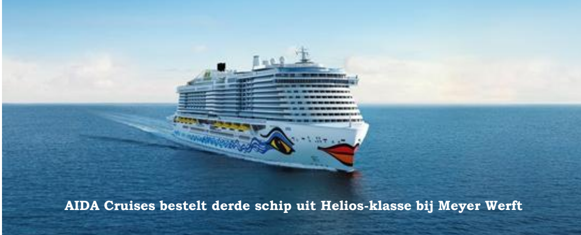
AIDA Cruises bestelt derde schip uit Helios-klasse bij Meyer Werft

AIDA Cruises heeft bekendgemaakt dat het een derde nieuwbouwschip heeft besteld bij de Duitse scheepsbouwer Meyer Werft in Papenburg. Het wordt het derde nieuwe generatie schip in de Helios-klasse. Het eerste schip, AIDAnova, komt dit najaar in de vaart. De zusterschepen volgen in respectievelijk 2021 en 2023. De nieuwe schepen zullen volledig opereren op vloeibaar aardgas (LNG), de meest milieuvriendelijke en emissiearme fossiele brandstof met dank aan de vier dual-fuel motoren. Het nieuwe schip krijgt een brutotonnage van 180.000 en een capaciteit van 2.700 hutten. 'Met deze nieuwe order zorgen we voor de verdere groei van de cruisevaart op de lange termijn en kunnen we ook in de toekomst spannende aanbiedingen voor dit gestaag groeiende vakantiesegment aanbieden. Dankzij een nog grotere variëteit aan boord openen we nieuwe mogelijkheden om nieuwe doelgroepen binnen alle doelgroepen aan te trekken voor deze unieke vakantie-ervaring', aldus Felix Eichorn, president van de Duitse cruisemaatschappij AIDA Cruises. ((Bron en afbeelding: cruisereiziger.nl, Marco, 27 februari 2018). (Foto onder AIDAluna: Meyer Werft/Hero Lang, 19-3-2009).