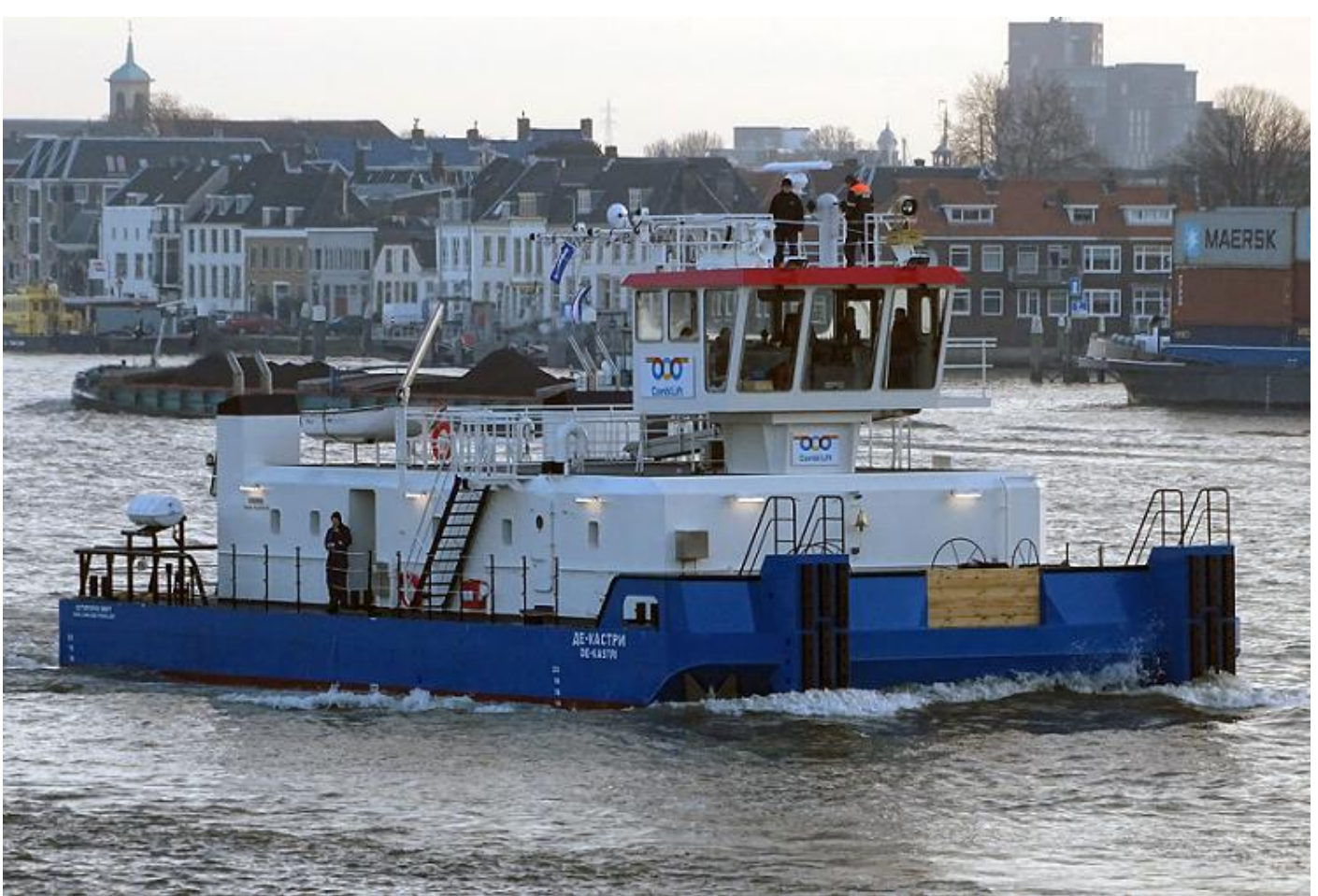
DE-KASTRI, passage Dordrecht/Zwijndrecht, 8-2-2018