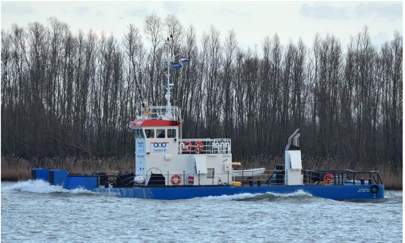
3d.m.s. SVOBODNY op proefvaart