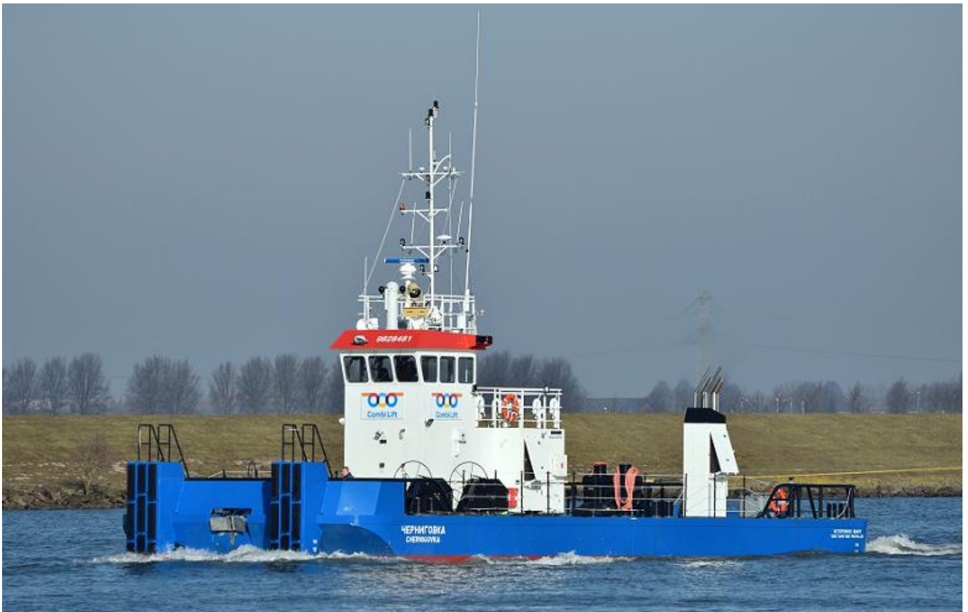
CHERNIGOVKA, IMO 9828481, 22-2-2018

4 x Pusher-Tugs 2612SD (bouwnummers 571773-76, IMO, 9828510, 9828522, 9828534 en 9828546) komen van Niron Staal BV, Amsterdam, waarna ze worden afgebouwd in Gorinchem en Hardinxveld. 230 GT. 25,90 (23,95) x 8,50 meter. 2 x 780 EPK, 574 kW, Caterpillar C12, twee schroeven.