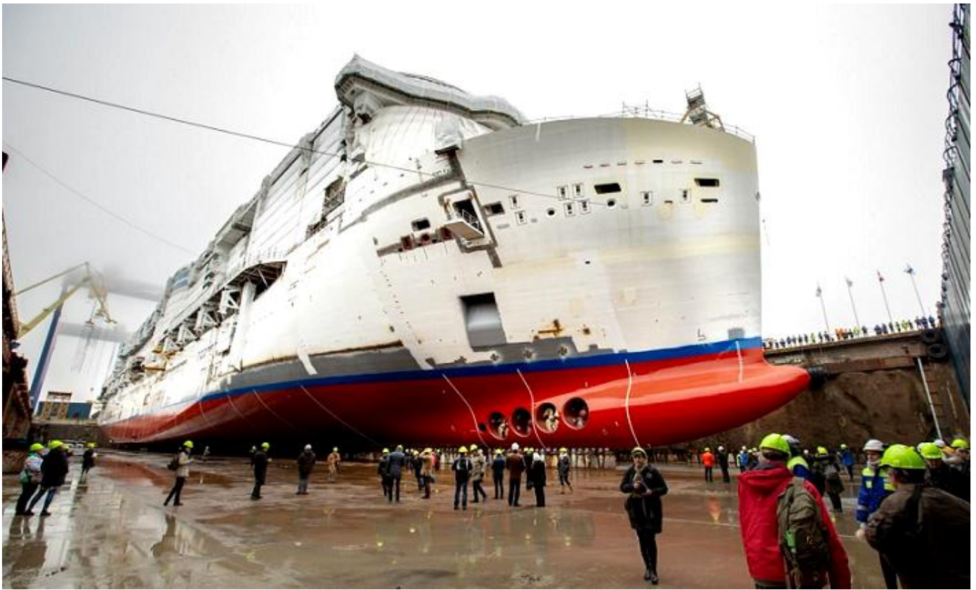
COSTA SMERALDA, IMO 9781889, 15-3-2019 te water gelaten onder bouwnummer Meyer Turku 1394, 3-10-2019 geplande oplevering aan Costa Crociere S.p.A., Genua-Italië. 183.900 GT.