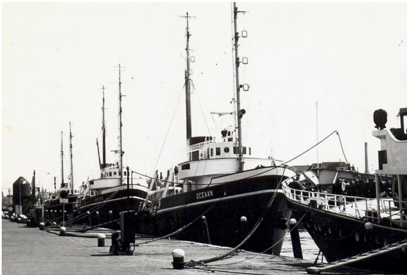
OCEAN en OOSTZEE te Maassluis

Roepsein PGNQ. Brandmerk 8411 Z ROTT 1953. 497 BRT, 79 NRT. 48,62 (45,22) x 8,84 x 4,96 x 4,450 meter. 180 ton bunkers. 14 kn. 203 ton bunkers. 2.000 IPK, 1.450 EPK, 6 cyl, 4 tew, 520 x 740, M.A.N., N.V. J. & K. Smit's Machinefabrieken, Kinderdijk.