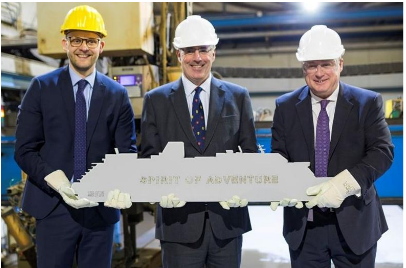
SPIRIT OF ADVENTURE, 27-3-2019 aanvang van de bouw met het snijden van het eerste stuk staal, in aanbouw voor de Britse cruisereederij Saga Cruises bij Meyer Werft te Papenburg. Een zusterschip van de SPIRIT OF DISCOVERY die in juli dit jaar wordt opgeleverd aan Saga Cruises. De oplevering van de SPIRIT OF ADVENTURE staat gepland voor de zomer van 2020. 58.250 GT. 999 passagiers.