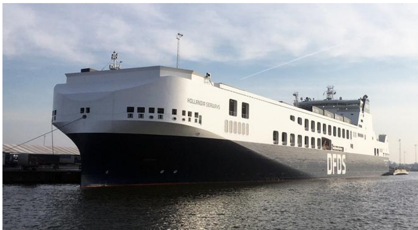
HOLLANDIA SEAWAYS van DFDS garriveerd te Gent

HOLLANDIA SEAWAYS, IMO 9832585, 22-11-2018 kiel gelegd, 9-10-2019 opgeleverd door Jinling Shipyard (JLZ9160410) als HOLLANDIA SEAWAYS aan DFDS A/S, Kopenhagen-Denemarken. 60.465 GT, 38.119 NT, 17.048 DWT. 235,00 (232,00) x 33,03 x 9,10 x 7,400 meter. 6.400 meter opstellengte. 10-2019 van Yizheng, China. 19-10-2019 van Singapore via Kaap de Goede Hoop naar Vlaardingen, 22-11-2019 ETA te Vlaardingen. 20-11-2019 op Hoek van Holland Anchorage. 22-11-2019 te Vlaardingen. 23-11-2019 van Immingham naar Gothenborg, 25-11-2019 te Gothenborg. 29-11-2019 gedoopt HOLLANDIA SEAWAYS door Ragna Alm, echtgenote van Roger Alm, President of Volvo Trucks. 30-11-2019 van Gothenborg naar Gent. Ingezet op de dienst Gothenborg-Gent. (Foto: R.P. van de Wetering, 22-11-2019)