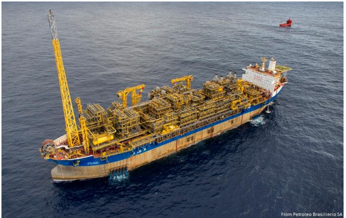
From Petroleo Brasileiro SA

FPSO CIDADE DE SAQUAREMA, IMO 9179608, Offshore Processing Ship, 7-5-1999 te water, 26-1-1999 kiel gelegd, 9-7-1999 opgeleverd door Hyundai Heavy Industries Co. Ltd. (1163) als ELISABETH MAESK aan A.P. Møller Singapore Pte. Ltd., Singapore. 159.187 GT, 104.027 NT, 308.491 DWT. 12-4-2006 verkocht aan Oceanic Oil Venture Inc., Panama, in beheer bij Interorient Navigation Co. Ltd., 2006 herdoopt LEANDER. 2008 in beheer bij Interorient Marine Service (Cyprus) Ltd. 22-7-2010 (e) in beheer bij Thome Ship Management Pte. Ltd. 13-12-2011 (e) verkocht aan SBM Production Contractors Inc., Marly, 12-2011 vlag: Bahamas, in beheer bij SBM Offshore N.V., Schiedam, 12-2011 herdoopt LEA. 1-8-2014 herdoopt FPSO CIDADE DE SAQUAREMA. 2015 verbouwd van VLCC tot Offshore Processing Ship, 168.407 GT, 278.610 DWT. 2016 verkocht aan Beta Lula Central S.a.r.l., Bahamas, in beheer bij SBM Production Contractors Inc. S.A., Marly en Wilhelmsen Ship Management Sdn. Bhd., Kuala Lumpur. 7-2016 ingezet voor Petroleo Brasileiro S.A. op Lula Central Field. 11-2019 een 5 procent minderheidsbelang in de FPSO CIDADE DE SAQUAREMA overgenomen door SBM. (Foto: Petroleo Brasileiro S.A.).