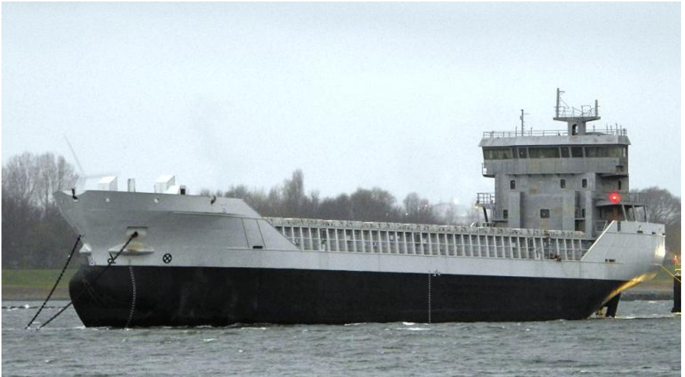
VEKA 759, IMO 9626194, t.b.n. LONGBEACH, foto: Patrick Blankwaard, 5-4-2021

De ESCAPE kreeg op 6 april op circa 9,5 mijl ten noorden van Vlieland problemen met de stuurinrichting, GUARDIAN stand-by. De volgende dag maakte de GUARDIAN vast, MULTRATUG 29 van Den Helder naar de ESCAPE, vanwege het slechte weer maakte de MULTRATUG 29 niet vast en ging de verloren containers van de BALTIC TERN lokaliseren. Toen het weer verbeterde vastgemaakt door de MULTRATUG 4.