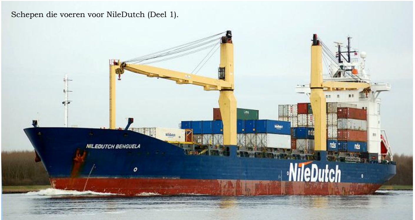
Schepen die voeren voor NileDutch (Deel 1).

ND 1 NILEDUTCH BENGUELA, 2006-2007, IMO 9161209, 4-5-1998 kiel gelegd, 21-9-1998 opgeleverd door Flensburger Schiffbau-Ges.m.b.H. & Co. K.G. (699) als FRIEDRICH OLDENDORFF aan Wavelength Shipping Corp., Monrovia-Liberia (ELVH9), in beheer bij Egon Oldendorff G.m.b.H. & Co. K.G.