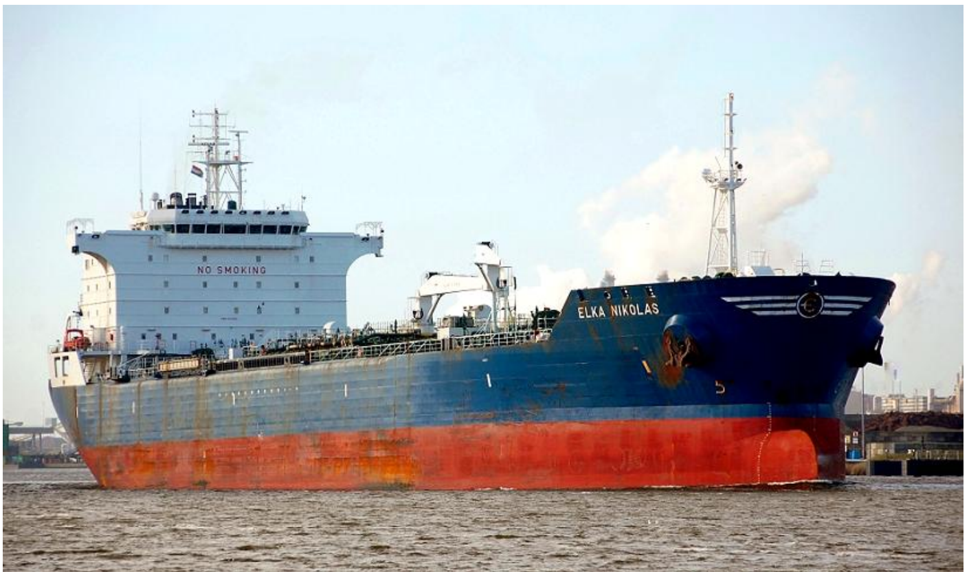
ELKA NIKOLAS, 15-2-2018

GUST, IMO 9876921, LPG Tanker, 12-2018 in aanbouw onder bouwnummer SHIP 843 bij Ship and Steel Building (Sas) te Foxhol, 15-6-2021 geplande oplevering als GUST aan Chemgas Shipping B.V., Rotterdam. 2.999 GT, 2.450 DWT.