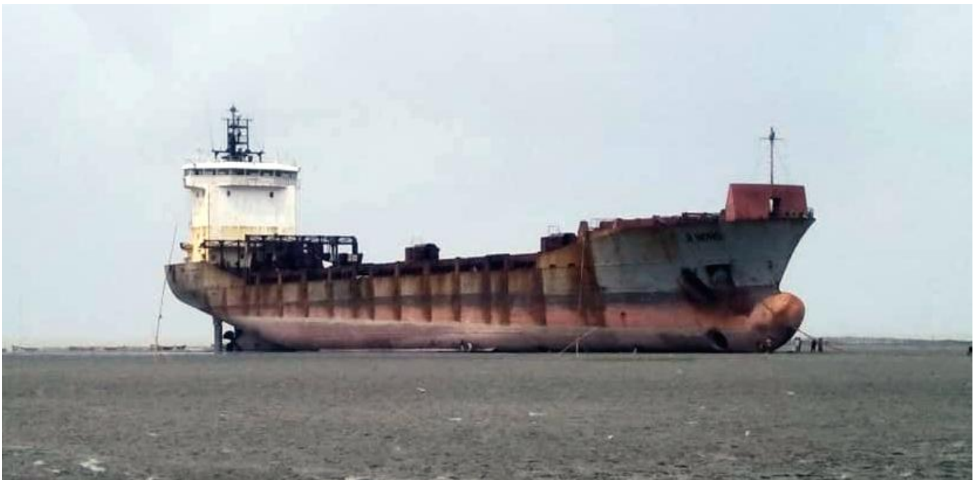
JI HONG, ex BANJAARD op het strand te Chattogram, foto: Fazlur Rahman

2021 verkocht voor sloop naar Bangladesh. 9-3-2021 van Fuzhou naar Chittagong. 22-3-2021 op Chittagong (Chattogram) Anchorage. 31-3-2021 te Chittagong op het strand gezet om gesloopt te worden. (Foto: R.P. van de Wetering, 20-10-2005).