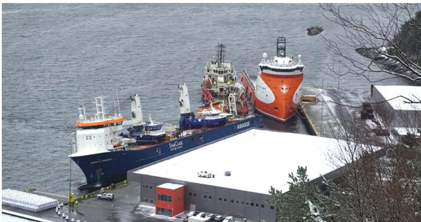
EEMSLIFT HENDRIKA afgemeerd te Flatholmen bij Ålesund, foto: Kristian Haug Hansen / TV 2 (LK)