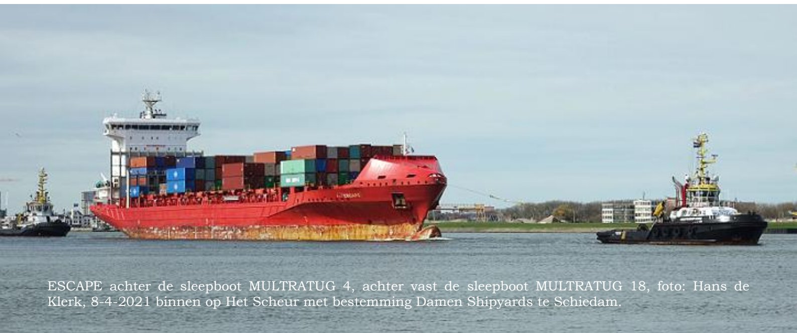
ESCAPE achter de sleepboot MULTRATUG 4, achter vast de sleepboot MULTRATUG 18, foto: Hans de Klerk, 8-4-2021 binnen op Het Scheur met bestemming Damen Shipyards te Schiedam.