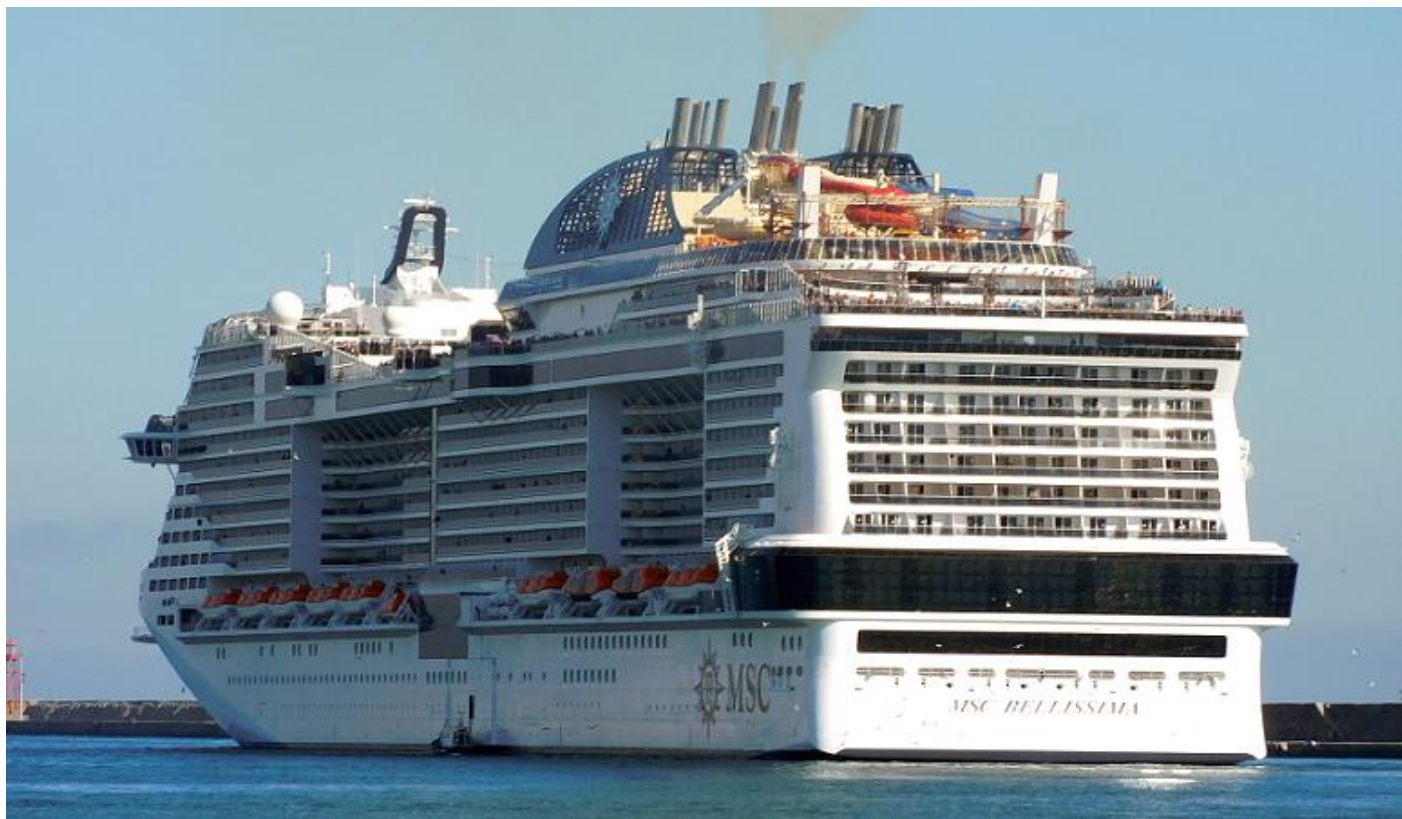
MSC BELLISSIMA, IMO 9760524, 2-6-2019, vertrek Genua

Mardi Gras debuteert op 31 augustus 2021 in Europa. Daarna wordt het schip gerepositioneerd naar New York voor een serie cruises. Vervolgens gaat het vanuit Port Canaveral, Florida het gehele jaar door varen naar de Caribbean. (Bron: cruisereiziger.nl, 18 juni 2019, Marco).