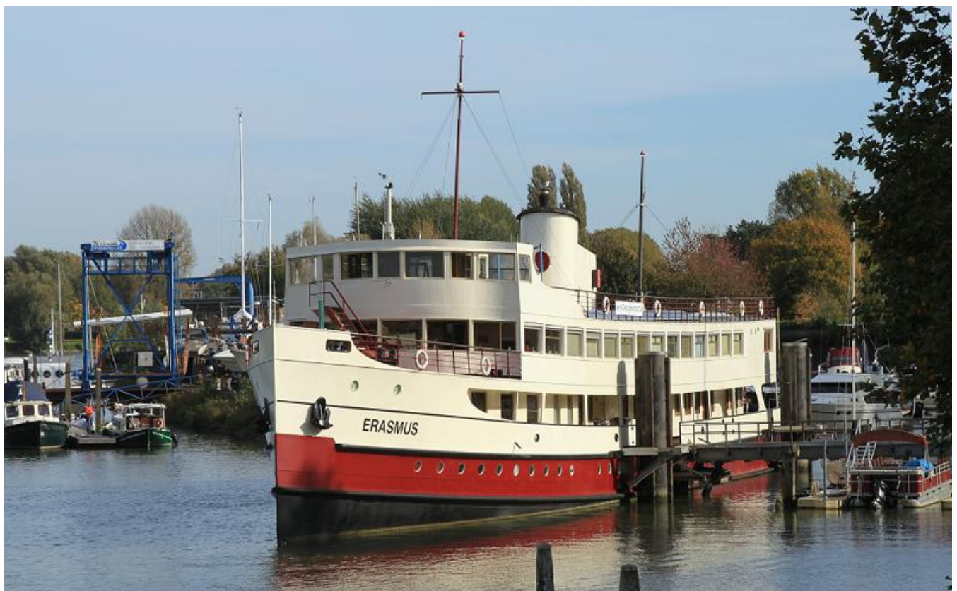
ERASMUS, te Dordrecht als logeerboot voor B&B

Voor de een zal de tentoonstelling een feest van herkenning zijn, voor de ander een kijkje achter de schermen van een Rotterdams icoon dat zijn koers de afgelopen eeuw steeds weer heeft aangepast aan nieuwe omstandigheden en veranderde behoeften van de passagiers. (Bron: maritiemnieuws.nl, 16-6-2019. Foto: PRINSESSEPLAAT: Foto onder: MARCO POLO op de Spido ponton,).