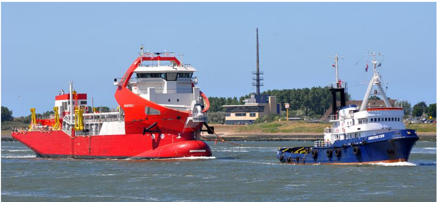
MAKRAN 1, IMO 9857872, 28-5-2020 het casco van een zuiger de MAKRAN 1 gearriveerd op de Nieuwe Waterweg met de Griekse sleepboot CHRISTOS XXIV (IMO 7041625, ex FAIRPLAY IX. 7-5-2020 te Tuzla), doorgebracht naar Neptun Shipyard te Hardinxveld-Giessendam om afgebouwd te worden.