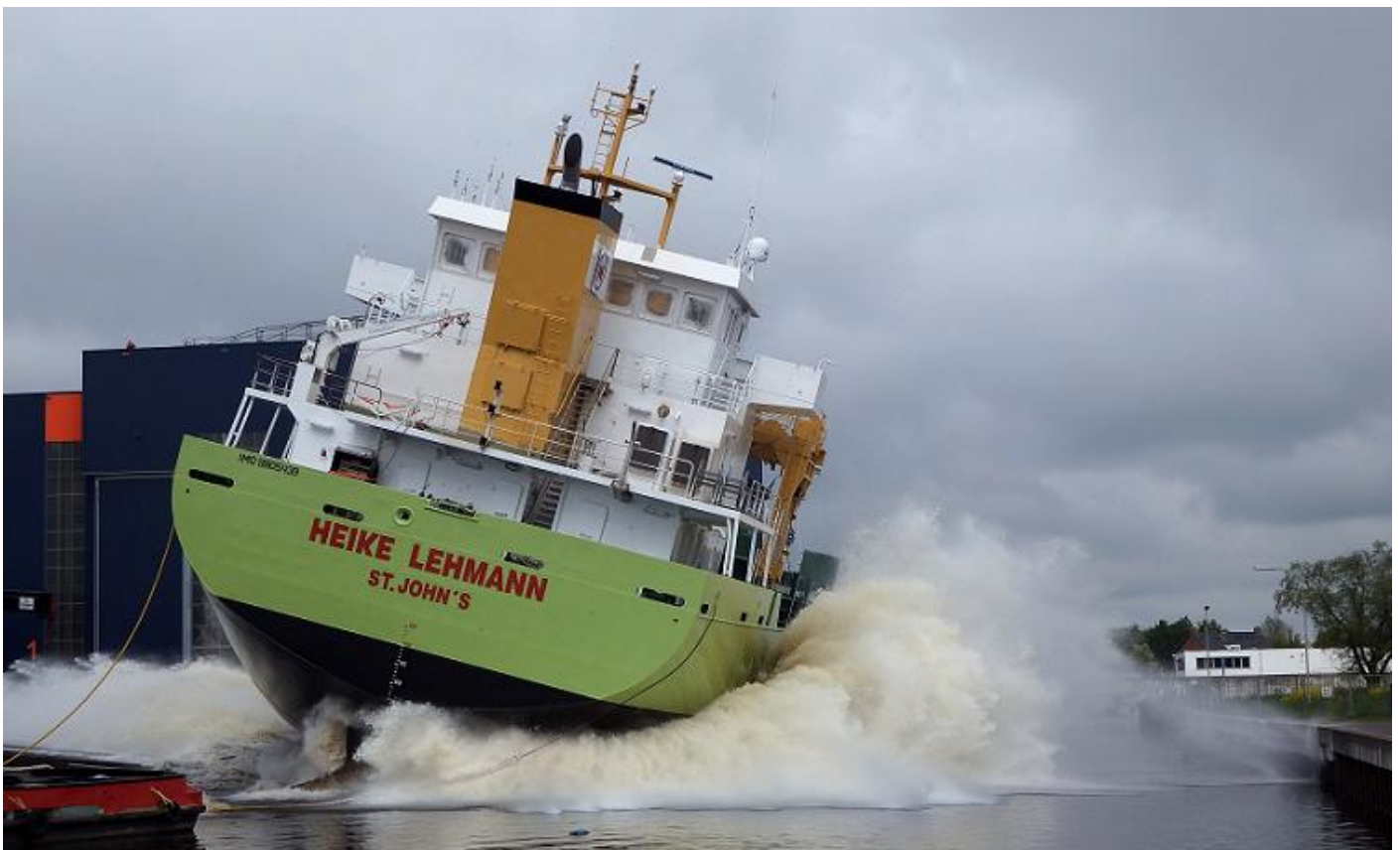
assistentie van de (duw)sleepboten WATERLELIE en WATERPOORT, in aanbouw voor Reederei Lehmann G.m.b.H. & Co. K.G., Lübeck, Duitsland, 17-7-2020 (e) geplande oplevering. 3.450 GT, 4.800 DWT.