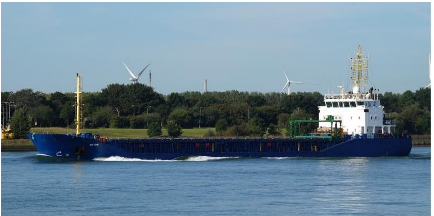
LONGBAY, IMO 9576703 (NB-251), 14-2-2008 contract, 25-12-2009 kiel gelegd, 8-6-2010 te water gelaten bij Onega Shipbuilding Yard CJSC (205), 23-7-2010 opgeleverd als KARELIA aan Baltasar Shipping S.A., Panama, in beheer bij Orion Shipping Co. 2.997 GT. 25-1-2011 (e) in beheer bij Onegoship CJSC en Orion Shipping Co. 6-11-2012 (e) in beheer bij Onegoship CJSC. 12-5-2015 verkocht aan Hermann Lohmann Schiffahrts G.m.b.H. & Co. K.G. M.S. "Anton", Antigua and Barbuda, in beheer bij Hermann Lohmann Bereederungen G.m.b.H. & Co. K.G. en Hermann Lohmann Schiffahrtsverwaltung G.m.b.H., herdoopt ANTON. 5-2016 herdoopt WILSON HALMSTAD. 7-10-2018 in beheer bij Longship B.V., Groningen, 10-2018 herdoopt LONGBAY. 8-9-2019 te Ipswich herdoopt ANTON. 13-9-2019 van Ipswich, 14-9-2019 gearriveerd op de St. Laurens haven, Botlek.