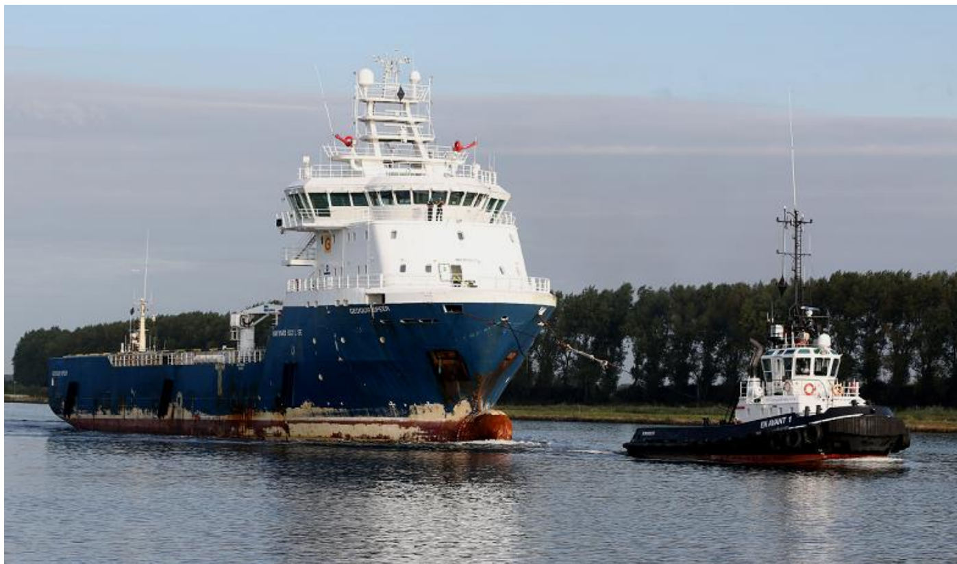
Het transport EN AVANT 1 met GEOQUIP SPEER (POLLUX achter) op het Noordzeekanaal

A.G., 8-2019 herdoopt GEOQUIP SPEER. 12-9-2019 vanaf Leirvik gearriveerd te IJmuiden achter de sleepboot EN AVANT 1 met bestemming Damen Shiprepair Oranjewerf, Amsterdam.