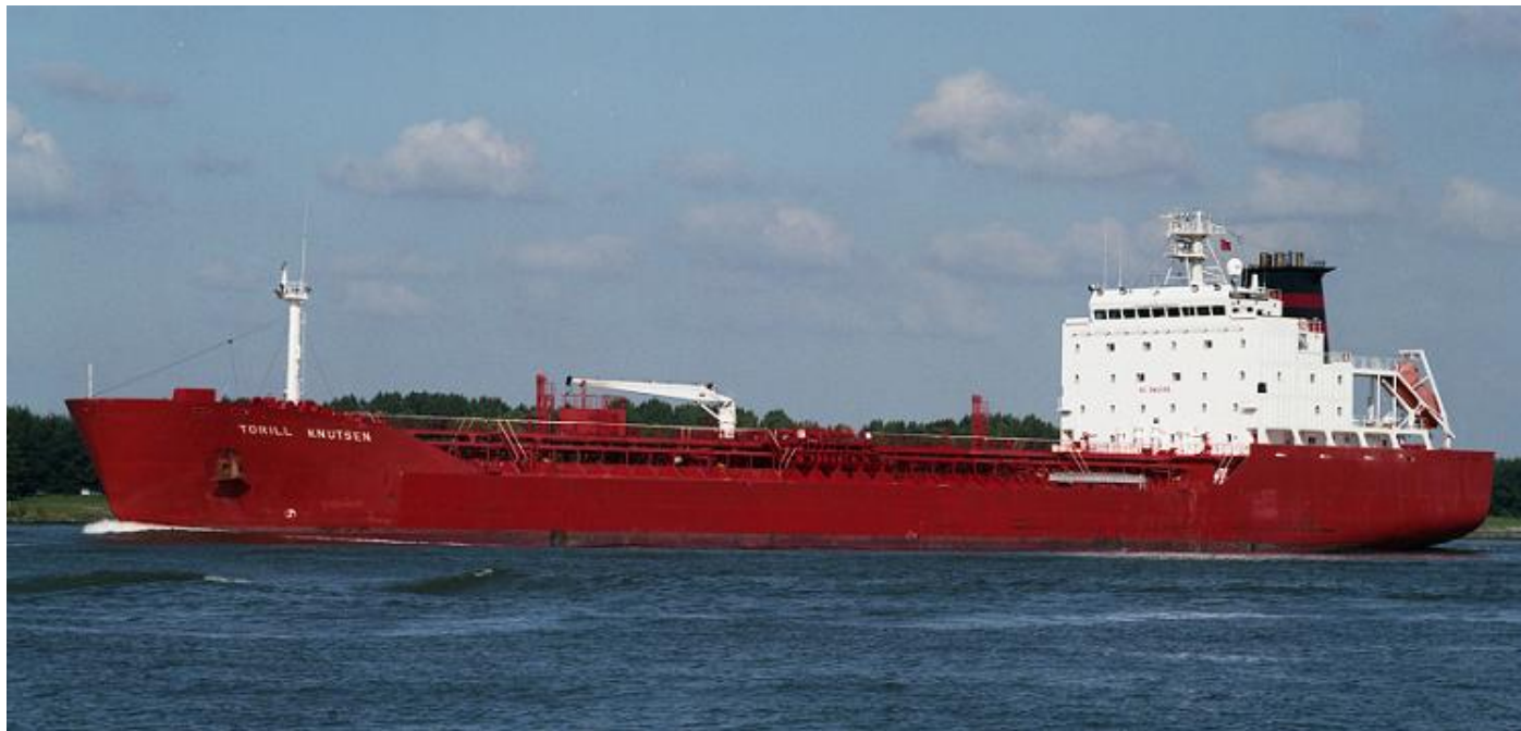
TORILL KNUTSEN, 17-8-1993, passage Maassluis

WIGGINS, IMO 9263978, 12-2002 opgeleverd als DMS CONQUEST. Offshore Support Vessel. 2.221 GT. 4-2005 herdoopt WIGGINS TIDE. 2019 verkocht voor sloop. 22-4-2019 verkocht aan RV International DMCC, vlag: Gabon, in beheer bij Hermes Maritime Services Pvt. Ltd., Navi Mumbai, Maharashtra, India, 4-2019 herdoopt WIGGINS. 16-8-2019 te Alang op het strand gezet om gesloopt te worden.