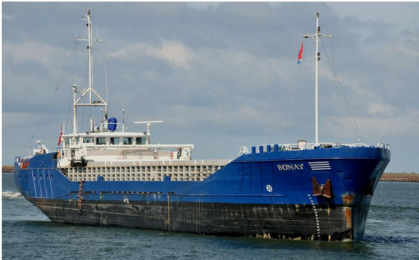
BONAY, IMO 9033878, zie NB-261 als WILLY II.