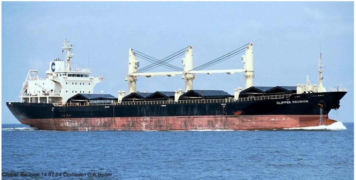
Clipper Reunion 14.07.04 Cuxhaven © A. Spörri

12.578 GT, 6.667 NT, 19.700 DWT. 154,75 (143.50) x 23,70 x 13,00 x 9,160 meter. B 26.900 m 3 . 14 kn. 8.080 EPK, 5.943, 8 cyl, 2 tew, 350 x 1400, MAN-B&W 8S35MC MK7, Ssangyong Heavy Industries Co. Ltd., Changwon. (STX Engine Co. Ltd.). 30-4-2003 herdoopt CLIPPER REUNION, roepsein C6S2074. 2-2007 en-bloc met CLIPPER RANGER verkocht aan Massoel Gestion S.A., Genève, ingebracht bij Massatlantic S.A., Bazel-Zwitserland, roepsein HBLA, in beheer bij V. Ships Switzerland S.A., Genève voor Massoel Gestion Maritime S.A., Genève, 7-3-2007 herdoopt AROSA. 9-5-2007 in beheer bij Massoel Meridian Ltd., Genève. 3-2011 in beheer bij Massoel Ltd., Genève. 24-2-2017 in beheer bij Massoel Shipping S.A., Genève. 30-1-2019 verkocht aan Massmariner S.A., Bazel-Zwitserland, in beheer bij Massoel Shipping S.A., Genève. 9-2019 verkocht voor circa $ 4.5 M. naar Egypte. (Foto: Andreas Spörri/Shipspotting, 14-7-2004 Cuxhaven).