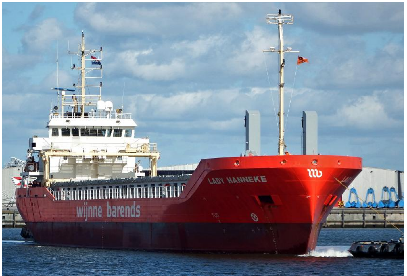
14-9-2019 vertrokken van Delfzijl naar de Eemshaven om te laden voor Kjøpsvik, Noorwegen.