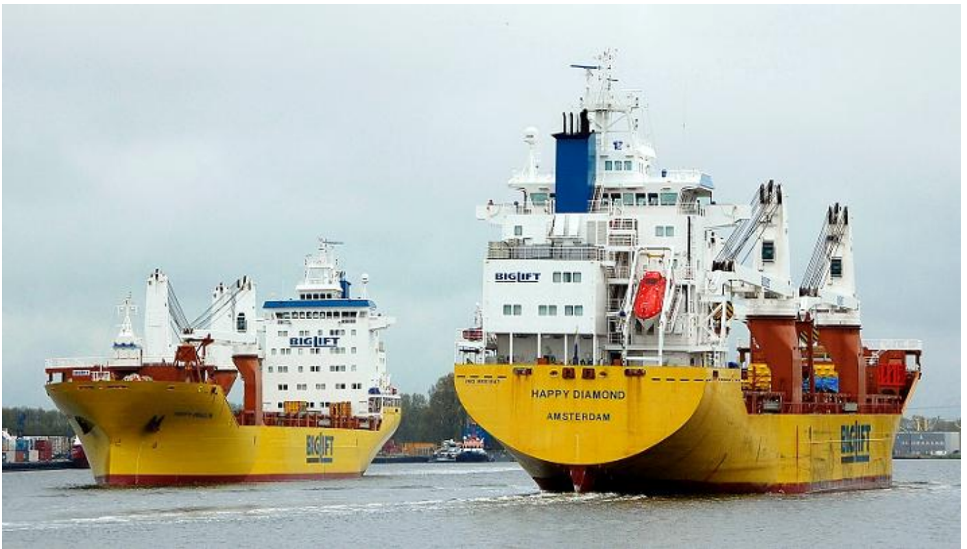
HAPPY DIAMOND passeerde het uitgaande zusterschip HAPPY DRAGON op het Noordzeekanaal, foto: Ruud Coster, 16 mei 2021.