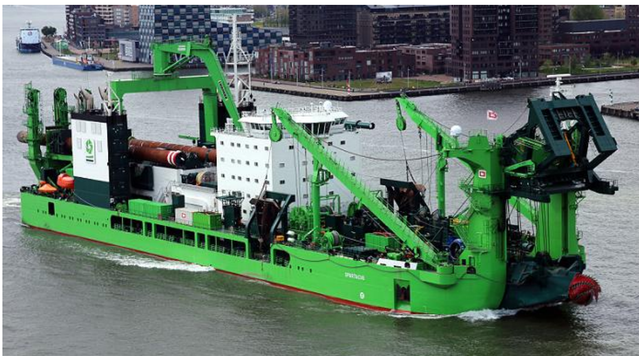
SPARTACUS, 23-5-2021, Rotterdam

SCOT ISLES, IMO 9728758, 17-12-2013 (e) kiel gelegd onder bouwnummer BODEWES HOOGEZAND 751, 4-6-2021 om 10:00 te water gelaten Royal Bodewes in Hoogezand, assistentie van de sleeptboten GRUNO en INVICTUS, 26-11-2021 geplande oplevering aan Scotline Ltd., Romford, vlag: United Kingdom. 3.450 GT, 5.150 DWT.