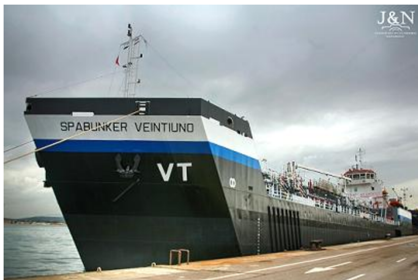
Foto Het schip SPABUNKER VEINTIUNO, destijds operationeel in de haven van Barcelona: Boluda/Ramón Acosta Merino).

Het Nederlandse bedrijf VT Shipping, onderdeel van VT Group, zal verantwoordelijk zijn voor de exploitatie van de bunkervloot die Boluda tankers tot nu toe beheert in haar contract met CEPSA, zoals het bekend staat puentedemando.com in bronnen. Dagenlang verspreidde het gerucht zich in de sector, van wat lijkt op een strategische beweging van de Spaanse oliemaatschappij die in handen is van Arabische kapitaal, in haar belang om zich te positioneren in de markt van de havens van Amsterdam en/of Rotterdam. (Bron: Juan Carlos Diaz Lorenzo, 6-2020 (vertaald). Foto Het schip SPABUNKER VEINTIUNO, destijds operationeel in de haven van Barcelona: Boluda/Ramón Acosta Merino).