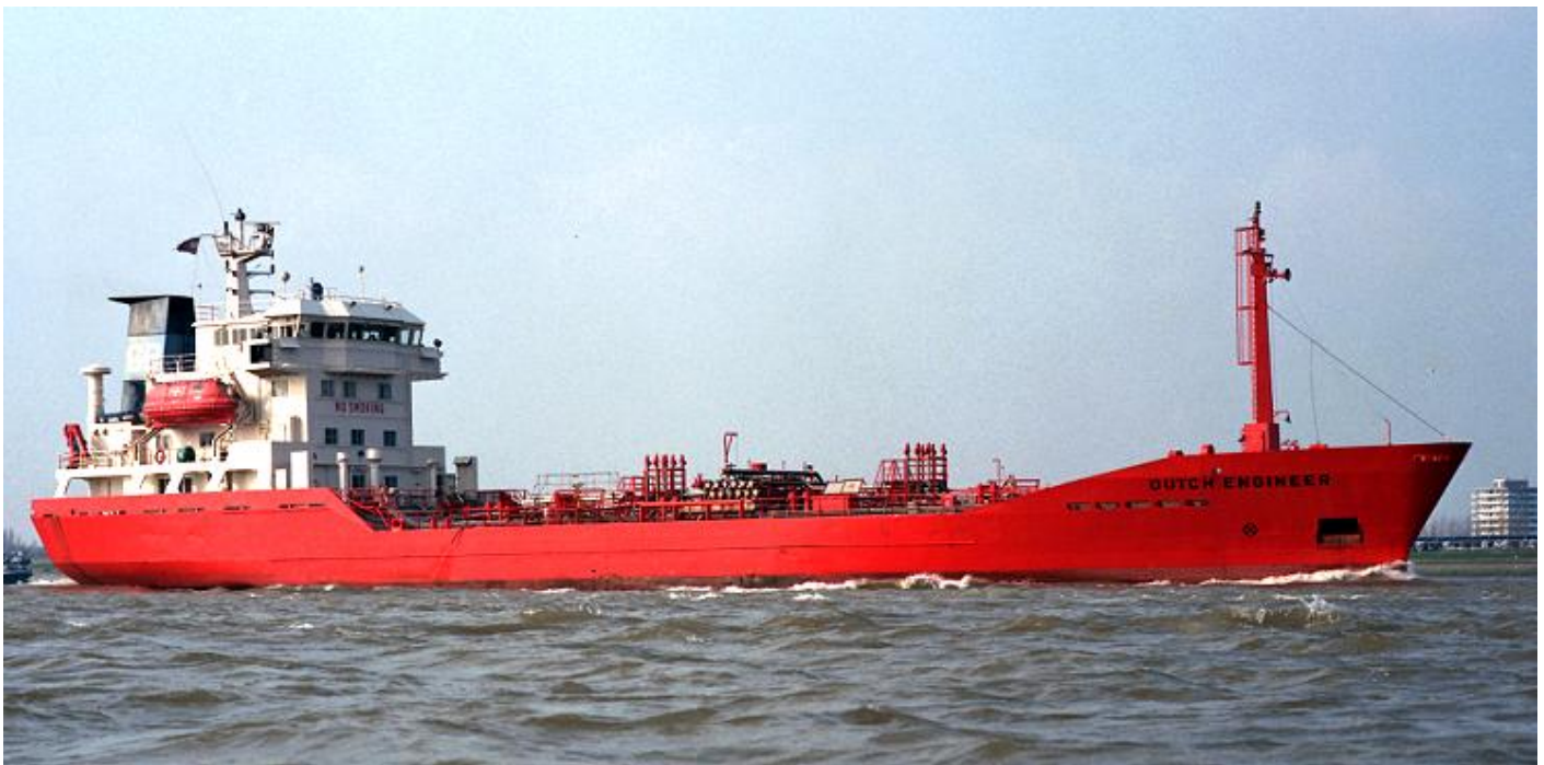
DUTCH ENGINEER, 5-4-1988