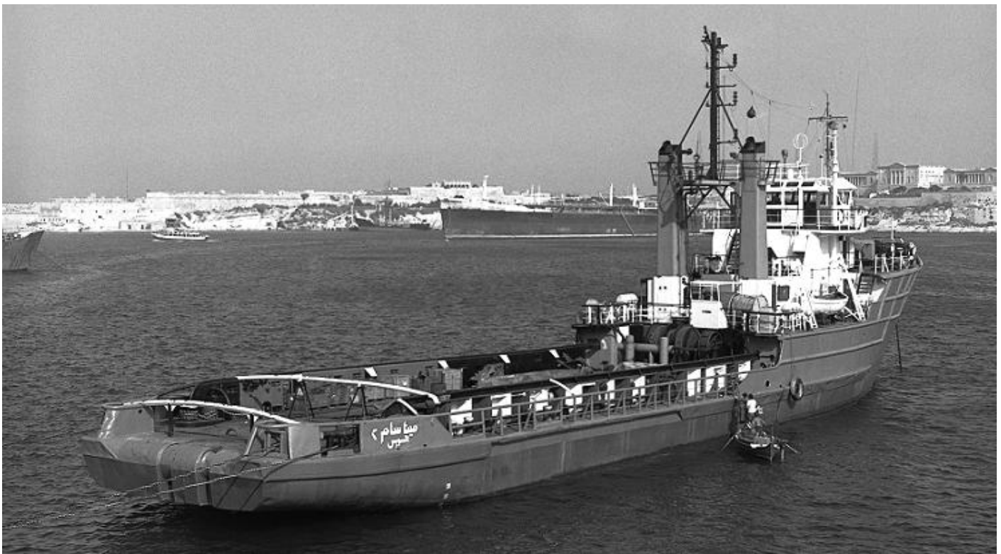
MINA SAM-II