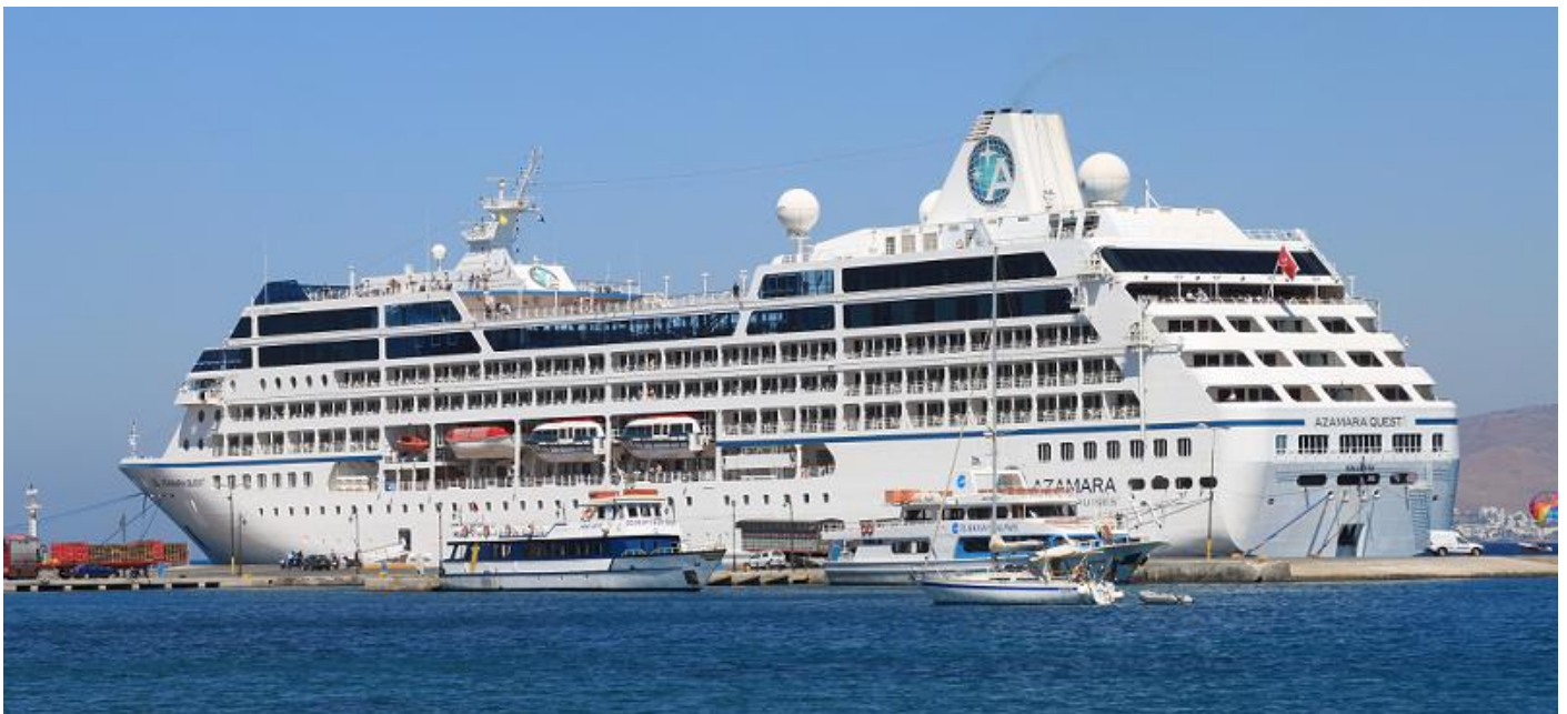
AZAMARA QUEST, ex R SEVEN

De Royal Caribbean Group heeft Azamara Club Cruises voor 201M USD verkocht aan Sycamore Partners. Dit betreft drie cruiseschepen, AZAMARA JOURNEY (2000-R SIX, 2005-BLUE DREAM, 2007-AZAMARA JOURNEY, 30.277 GT, 9200940), AZAMARA PURSUIT (2001-R EIGHT, 2003-MINERVA II, 2007-ROYAL PRINCESS, 2011-ADONIA, 2018-AZAMARA PURSUIT, 30.277 GT, 9210220) en AZAMARA QUEST (2000-R SEVEN, 2003-DELPHIN RENAISSANCE, 2006-BLUE MOON, 2007-AZAMARA QUEST, 30.277 GT, 9210218) en het intellectuele eigendom van Azamara.