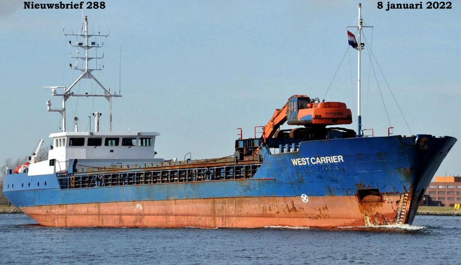
WEST CARRIER ex ALMENUM

ALEXANDRE, IMO 9858204, 9-12-2015 akte oprichting Alexandre B.V., 9-12-2015 bestuurder Briese Shipping B.V. in functie getreden, 23-12-2015 kiel gelegd onder bouwnummer ZHEJIANG ZENGZHOU ZZ075, in aanbouw voor Alexandre B.V., Scheemda, vlag: Nederland, 20-8-2021 geplande oplevering, 3.515 GT, 5.000 DWT, 8-7-2019 bestuurder Briese Nederland B.V. in functie getreden, 4-12-2020 Alexandre B.V. ontbonden door Besluit van de algemene vergadering/stichtingsbestuur, 15-12-2020 de rechtspersoon uitgeschreven wegens geen bekende baten meer aanwezig bij rechtspersoon, 9-2021 niet afgebouwd, voor de oplevering gesloopt.