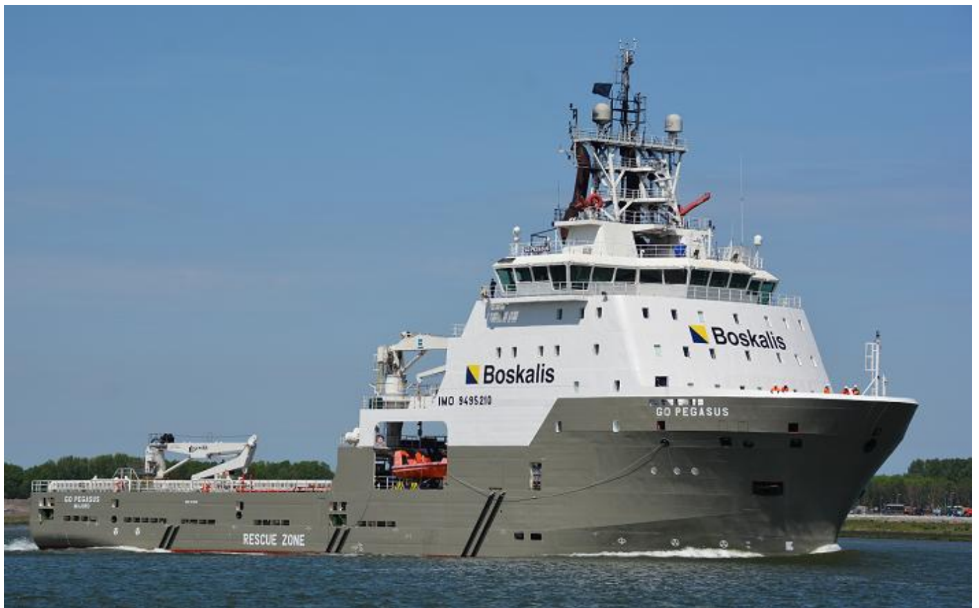
GO PEGASUS, IMO 9495210, in Boskalis kleuren