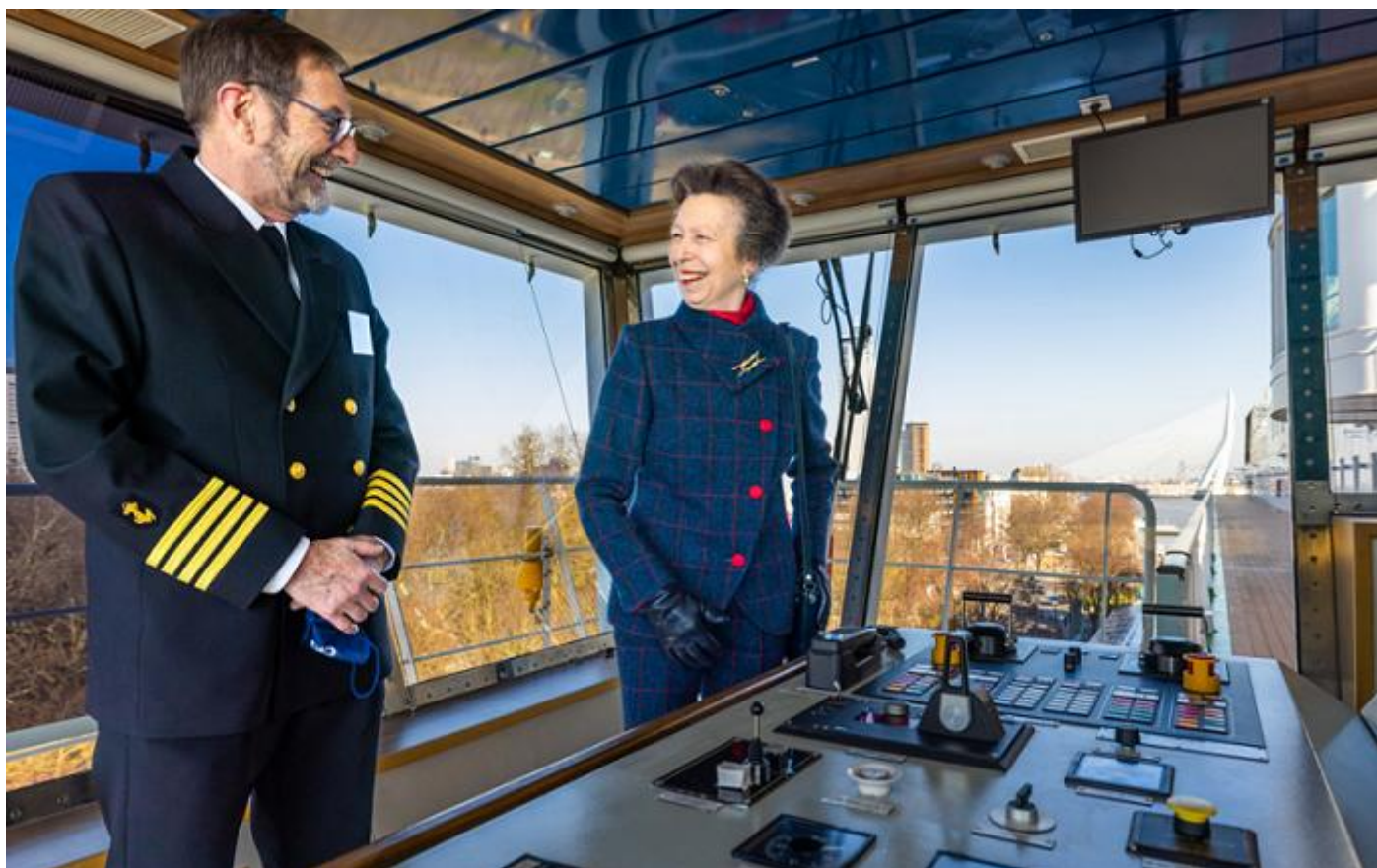
Prinses Anne op de brug in gesprek met de kapitein

Het was een droom, maar het was altijd een realistische droom, dus mijn felicitaties gaan naar jullie allemaal, in het bijzonder naar de oprichters, omdat Mercy Ships op zich al een daad van geloof was. Bedankt allemaal voor wat jullie de afgelopen jaren hebben bereikt. Het begrijpen van het belang van het trainen van trainers is iets dat Save the Children me heeft gebracht. Dus ik waardeer vooral de inspanningen die jullie op dat gebied doen.”