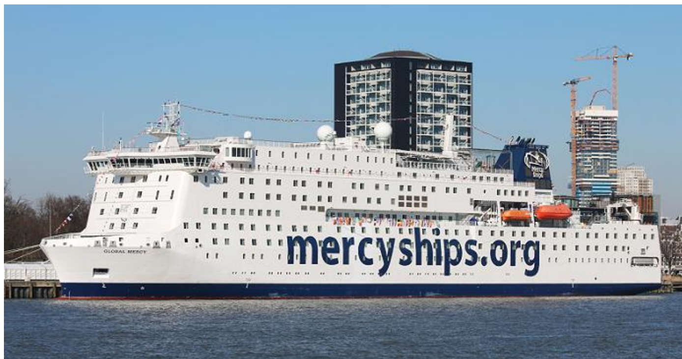
GLOBAL MERCY aan de Parkkade te Rotterdam, foto: Bert Lamers, 3-3-2022

Global Mercy is de grote zus van Africa Mercy, het huidige ziekenhuisschip van Mercy Ships. Met het nieuwe schip verdubbelt Mercy Ships haar impact. Niet alleen met levensreddende ingrepen, maar ook met opleidingen en trainingen voor lokale zorgmedewerkers in Afrika. Als beide schepen operationeel zijn, verwacht Mercy Ships elk jaar meer dan 5000 medische ingrepen te kunnen doen en meer dan 28.000 tandheelkundige ingrepen. Op dat moment zullen ze bovendien elk jaar meer dan 2.800 medische professionals opleiden. (Bron en foto's: https://www.mercyships.nl/ / 7 maart 2022).