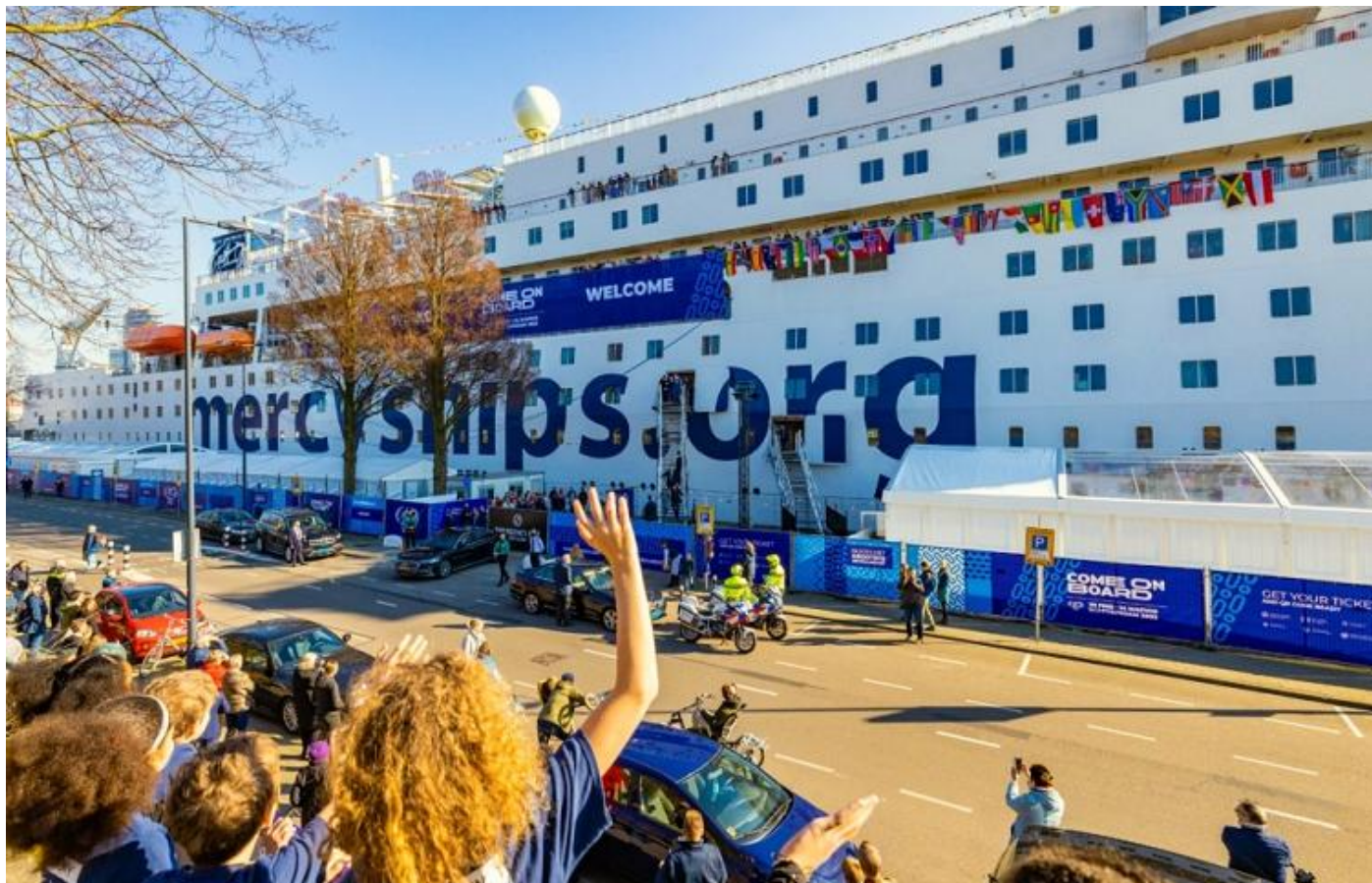
De prinses arriveert bij de Global Mercy

Het was een droom, maar het was altijd een realistische droom, dus mijn felicitaties gaan naar jullie allemaal, in het bijzonder naar de oprichters, omdat Mercy Ships op zich al een daad van geloof was. Bedankt allemaal voor wat jullie de afgelopen jaren hebben bereikt. Het begrijpen van het belang van het trainen van trainers is iets dat Save the Children me heeft gebracht. Dus ik waardeer vooral de inspanningen die jullie op dat gebied doen.”