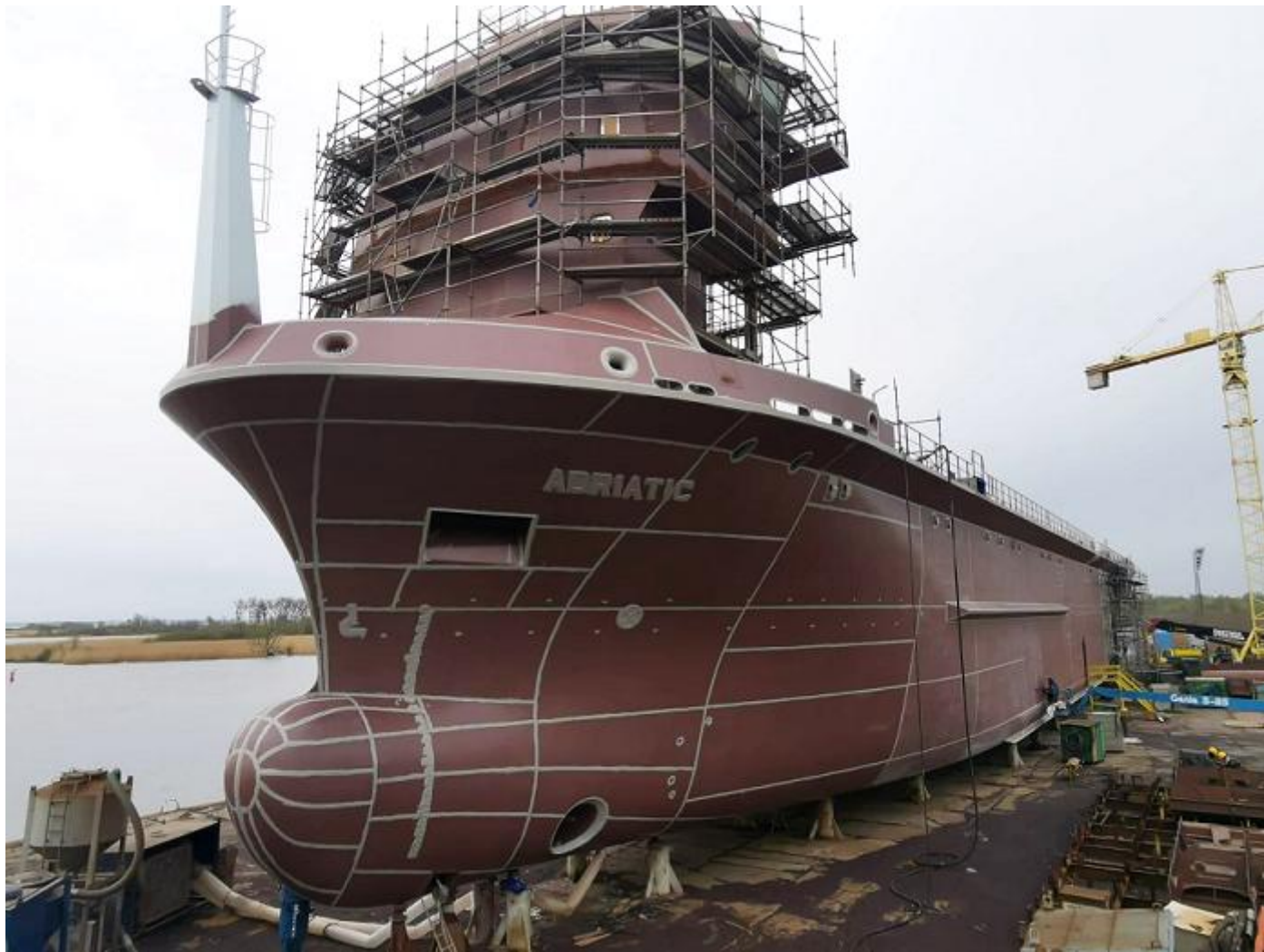
ADRIATIC, IMO 9944871, General Cargo Ship, 3.400 GT, 4.000 DWT, 6-2021 in aanbouw onder bouwnummer HARTMAN MARINE 013, 9-2022 geplande oplevering aan Hartman Seatrade B.V., Tollebeek, vlag: Nederland.