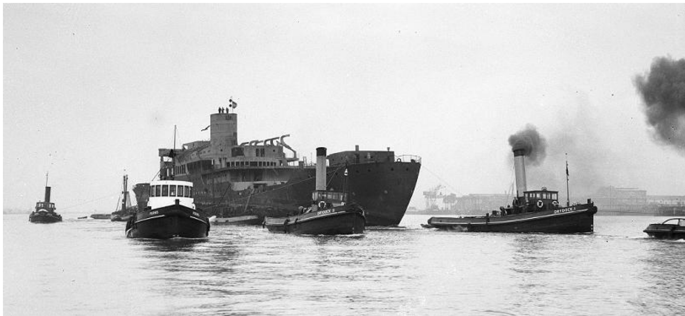
ZUIDERDAM, Het in de oorlog in de Nieuwe Waterweg gezonken m.s. Zuiderdam wordt versleept. De drie stoomslepers vooraan zijn de DRYDOCK I, DRYDOCK II en PERNIS. Foto: Lex de Herder, 11-1946, Auteursrechthouder: Gemeente Rotterdam (Stadsarchief).