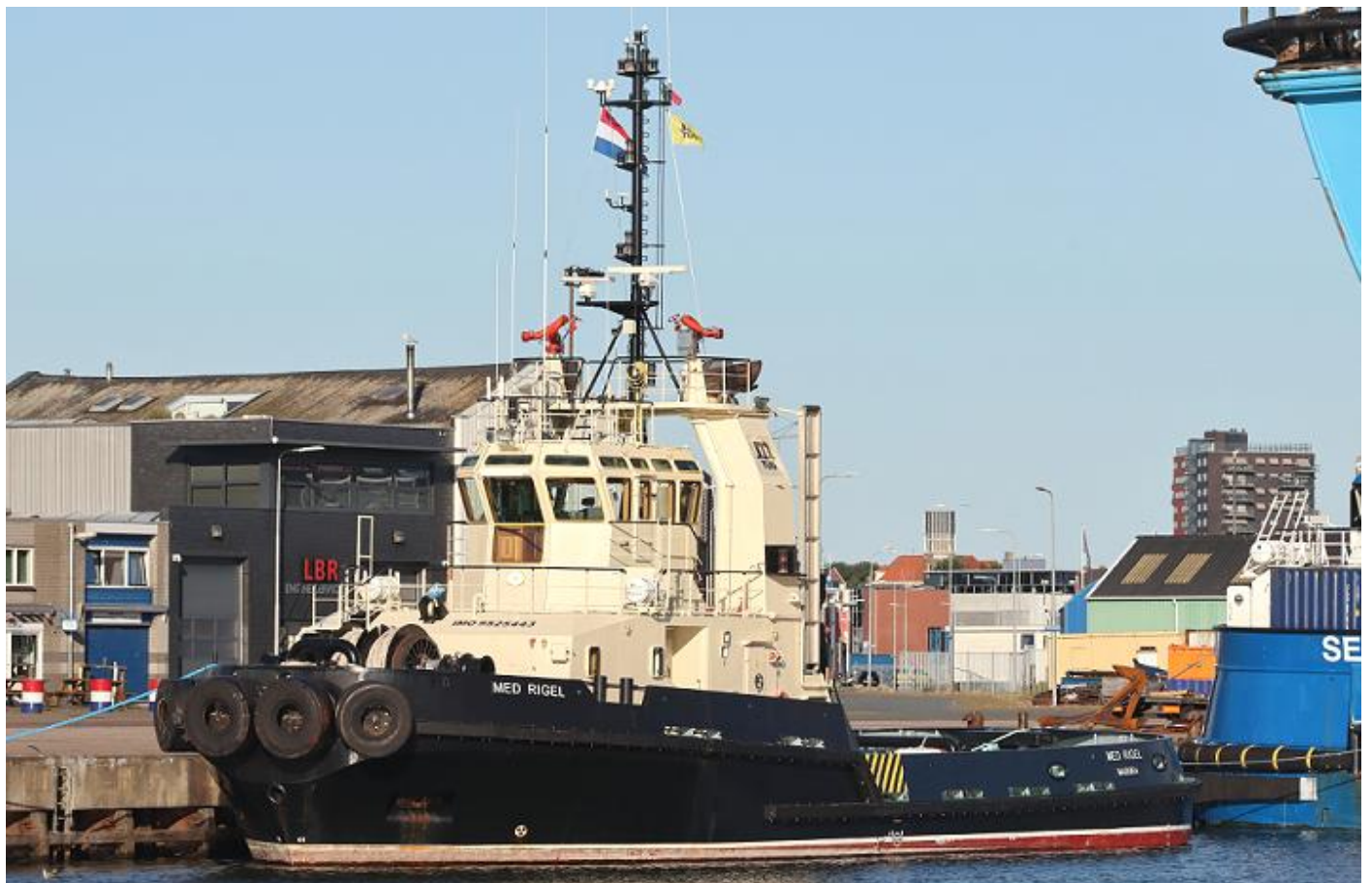
MED RIGEL, IMO 9525443, Pusher/Tug, 20-12-2007 contract, 30-9-2009 kiel gelegd, 25-6-2010 bouw gereed, 1-7-2010 opgeleverd door Astilleros Armon S.A. (689) als VEHINTICINCO aan Remolques Unidos SL, Spanje. 428 GT, 128 NT, 413 DWT, 5.978 EPK, 4.400 kW, 2 x 16 cyl, 4 tew, 170 x 215, 1.800 rpm., vertraagd naar 225 rpm., Caterpillar 3516C-HD, Caterpillar Inc., Indiana NE-09. 2-2011 verkocht aan Santander Lease S.A., EFC, Spanje, in beheer bij Remolques Unidos SL. 5-2022 verkocht aan Narrativa Basilar Unipessoal, Madeira-Portugal (CQQZ). 14-6-2022 herdoopt MED RIGEL. 26-7-2022 te Rotterdam. 31-7-2022 te IJmuiden.