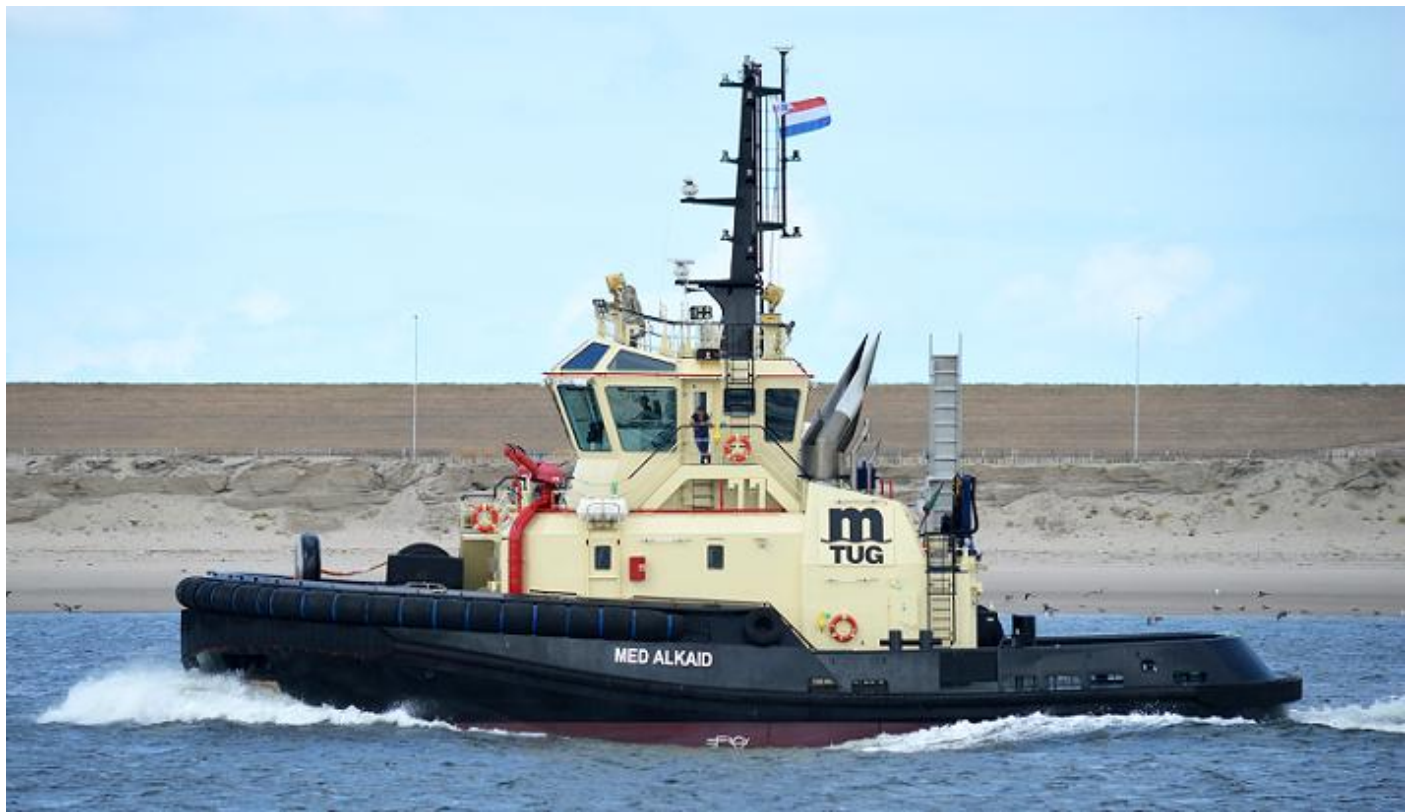
MED ALKAID, IMO 9803833, sleepboot, 4-1-2017 eerste staal, 24-4-2018 kiel gelegd, 14-2-2019 opgeleverd door Sanmar Denizcilik Makina ve Ticaret A.S. (94) als SANMAR TERMINAL XXIV aan Sanmar Denizcilik Makina ve Ticaret A.S., Tutkije (TCA5297). 461 GT, 143 DWT. 26-7-2022 vlag; Portugal (CQQZ) en herdoopt MED ALKAID. 4-8-2022 op Maasvlakte2.