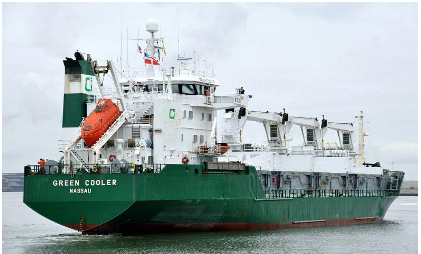
13-3-2012 naar de Haringhaven, Kotterkade, arriveerd uit Nouadhibou met vis van de H.171 CORNELIS VROLIJK om te lossen bij Vrolijk.