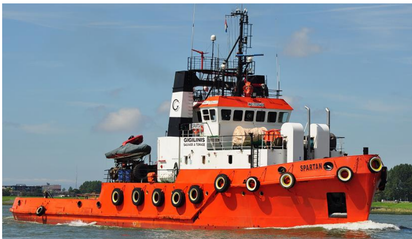
Sloopprijzen, info GMS, 8-1-2024