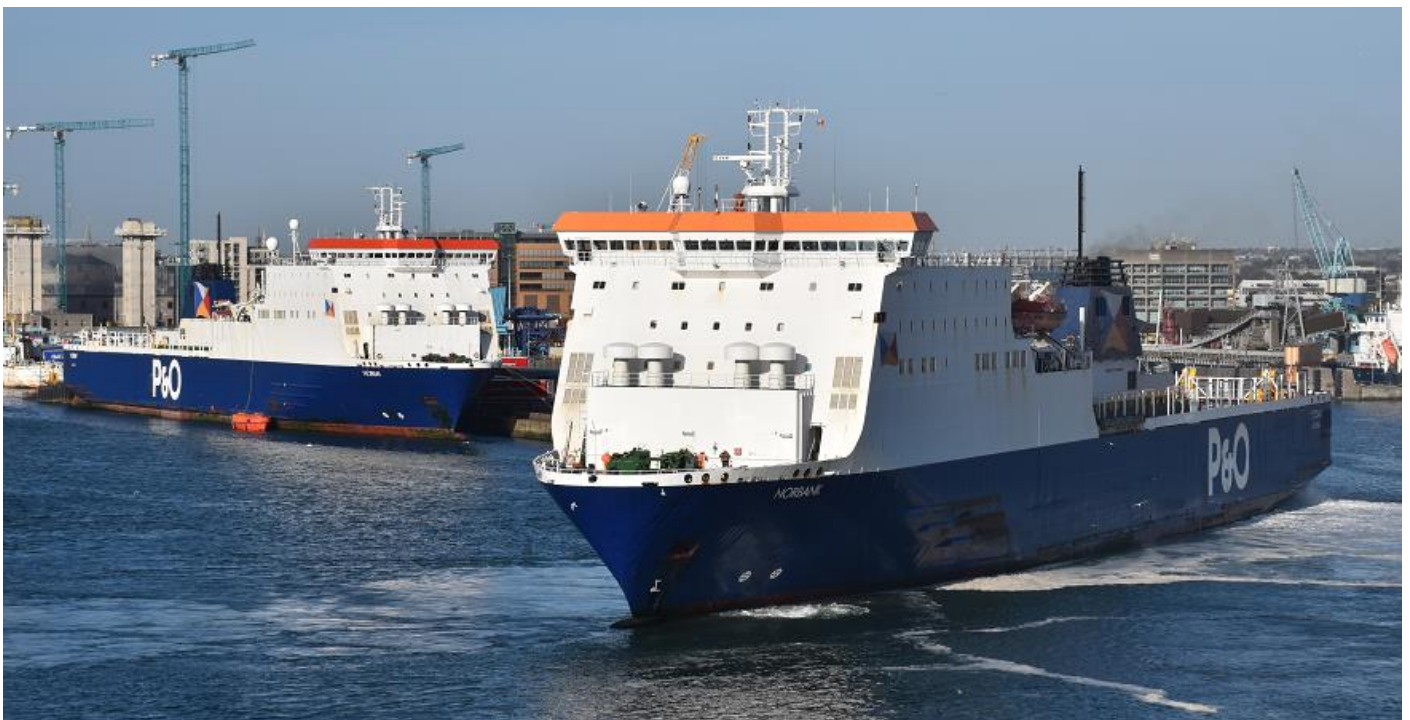
NORBANK en NORBAY te Dublin

Tot november 2023 was NORBAY één van de twee schepen die op de route Dublin-Liverpool van P&O Ferries varen. P&O Ferries exploiteerde daarna alleen nog de NORBANK, die naar verwachting tegen het einde van het jaar zal worden gesloten vanwege een gebrek aan ligplaatsen in de haven van Liverpool vanaf 2024.