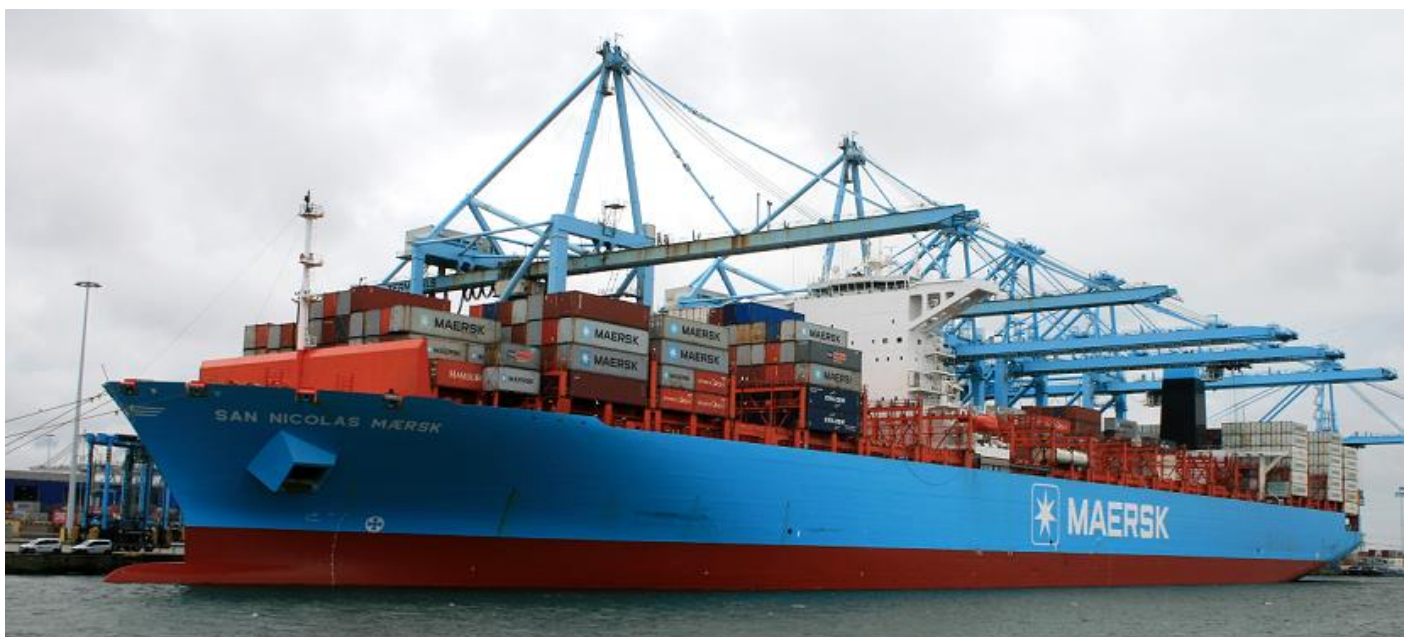
SAN NICOLAS MAERSK, ex CAP SAN NICOLAS, 1-7- 2023, Maasvlakte

MSC PALATIUM III, IMO 9336165, 26.435 GT, 2546 TEU. 17-2-2006 kiel gelegd, 30-6-2006 te water, 24-11-2006 opgeleverd door Jiangsu Yangzijiang Shipbuilding Co. Ltd. (YZJ2004-680C) als HAMMONIA PALATIUM. 3-2007 herdoopt CCNI NINGBO. 3-2009 herdoopt HAMMONIA PALATIUM. 3-2009 herdoopt MOL STABILITY. 9-2011 herdoopt EMIRATES ZAMBEZI. 4-2015 herdoopt HAMMONIA PALATIUM. 11-2022 herdoopt MSC PALATIUM III. 9-12-2023 van Mombasa naar Djibouti. De MSC PALATIUM III werd op 15 december 2023 rond 10.40 uur UTC 27 zeemijl ten westzuidwesten van Mukha, Jemen, in de zuidelijke Rode Zee, geraakt door een raket, terwijl ze in zuidelijke richting van Mombasa naar Jeddah voer. Er was brand aan boord na de explosie, waarbij de bemanning het bestreed. Op 16 december lag het schip ten anker bij Djibouti en was het vuur gedoofd en was de bemanning veilig.