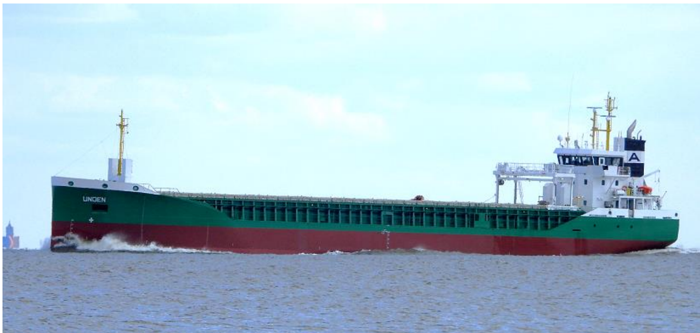
m.s UNDEN, 24-4-2024, proefvaart