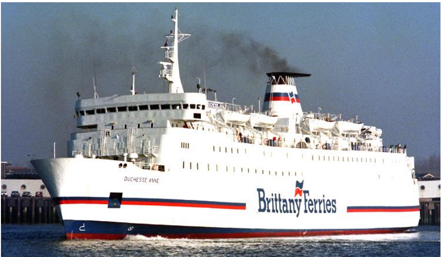
AKDENIZ, IMO 7615048, als DUCHESS ANNE, 26-1-1989